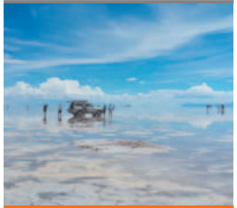
● El salar de Uyuni será uno de los atractivos que visitará la delegación.

MIL DÓLARES GASTA UN TURISTA EUROPEO EN PROMEDIO POR DÍA.