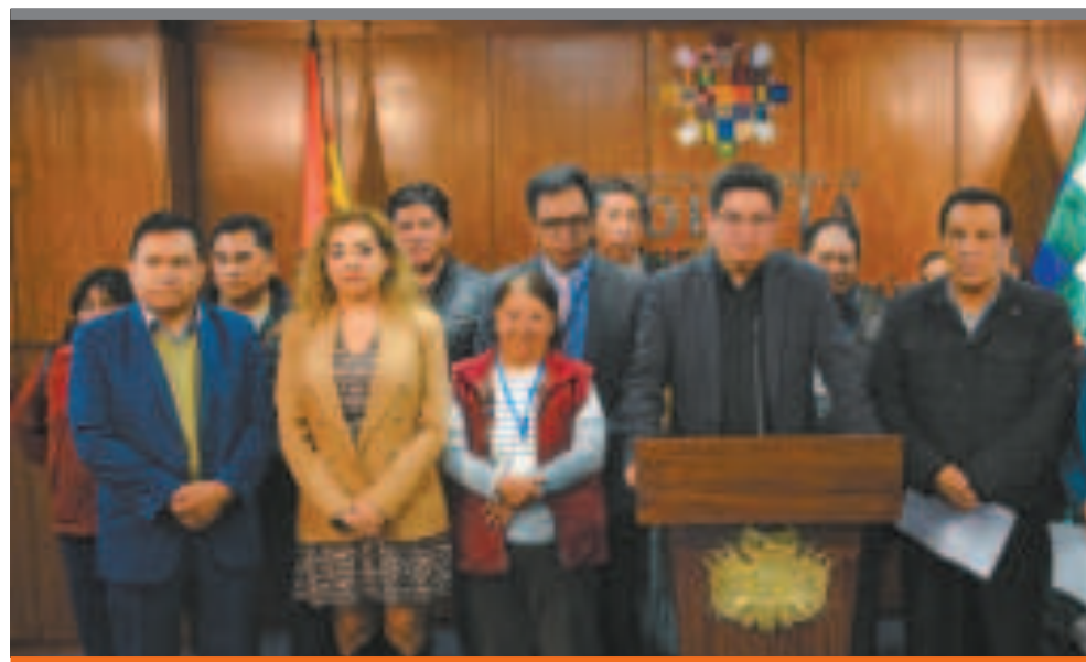
Las autoridades y la dirigencia del sector gremial en conferencia de prensa.