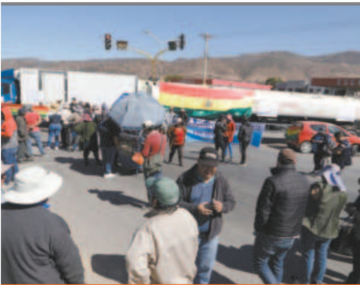
● Un punto de bloqueo del transporte pesado.