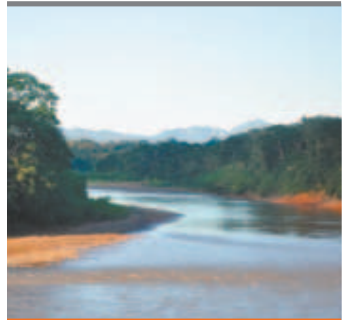
● El río Tequeje, ubicado en La Paz.