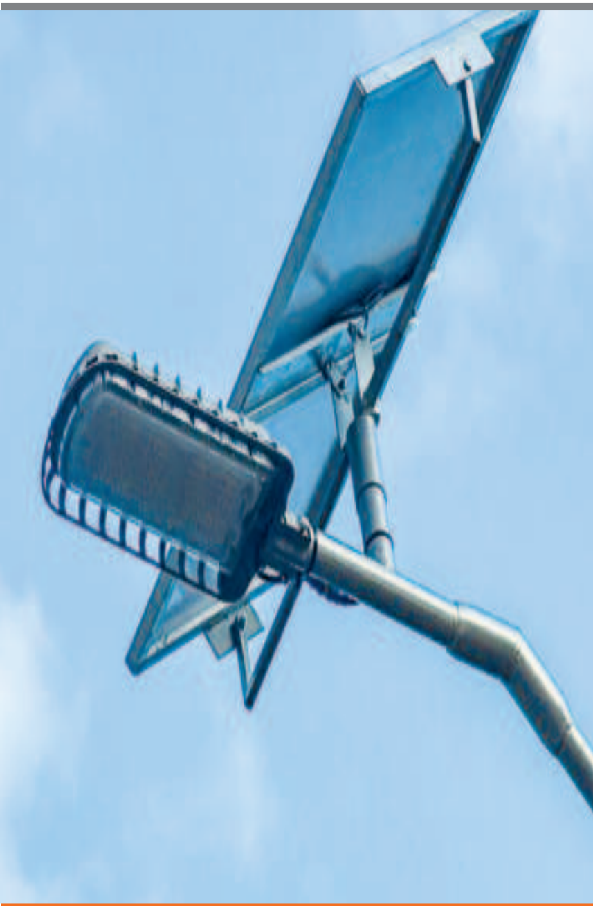
● Una luminaria ecológica equipada con panel solar.

► no y promueve el desarrollo de infraestructuras más limpias y eficientes, demostrando el liderazgo de la empresa estatal en la adopción de prácticas innovadoras y responsables”, dijo Vedia.