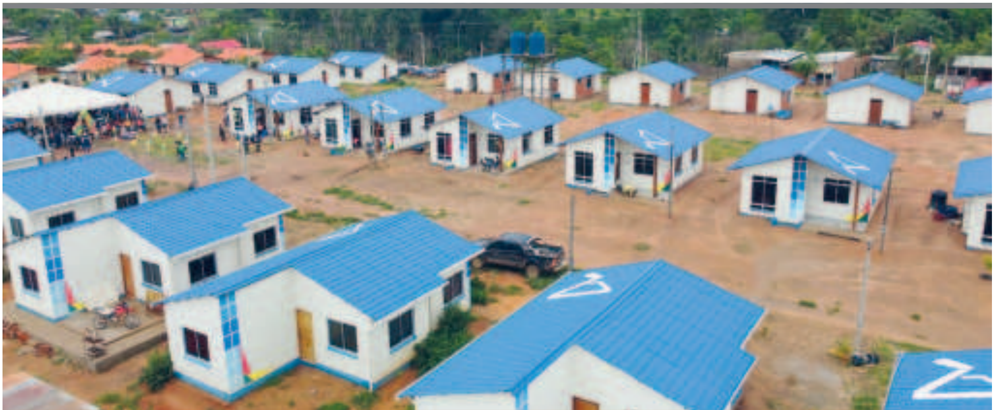
● Los proyectos de vivienda social llegan también a los sectores más alejados del país.