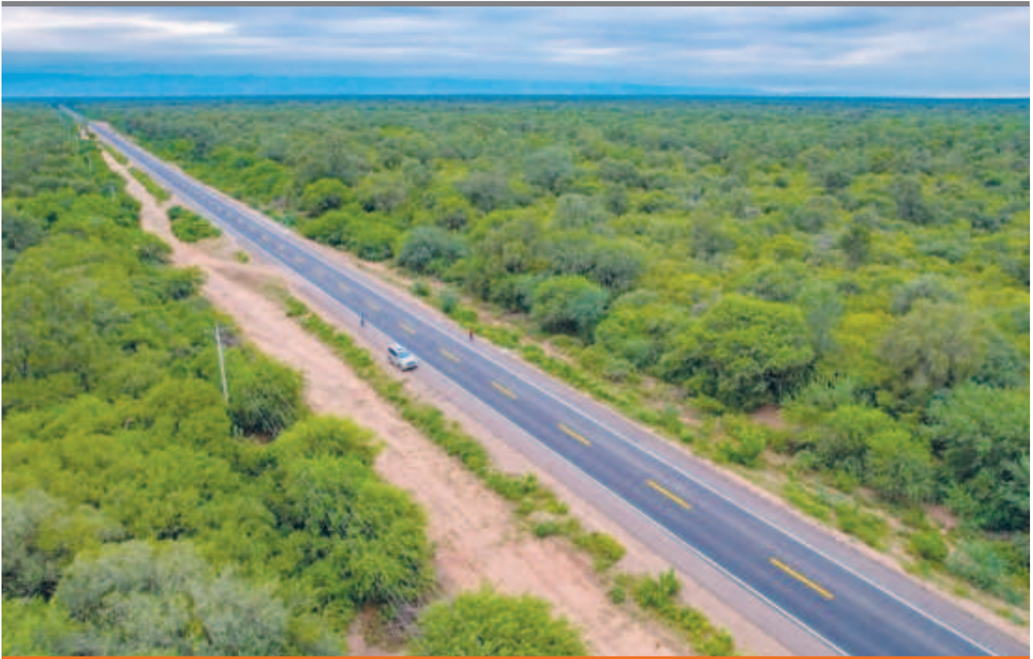
● La carretera Villa Montes-La Vertiente-Palo Marcado, en Tarija.