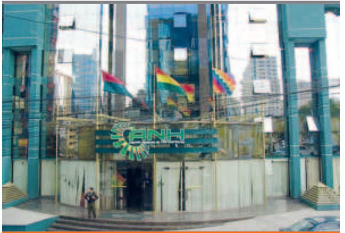
● Las oficinas de la ANH, en la ciudad de La Paz.