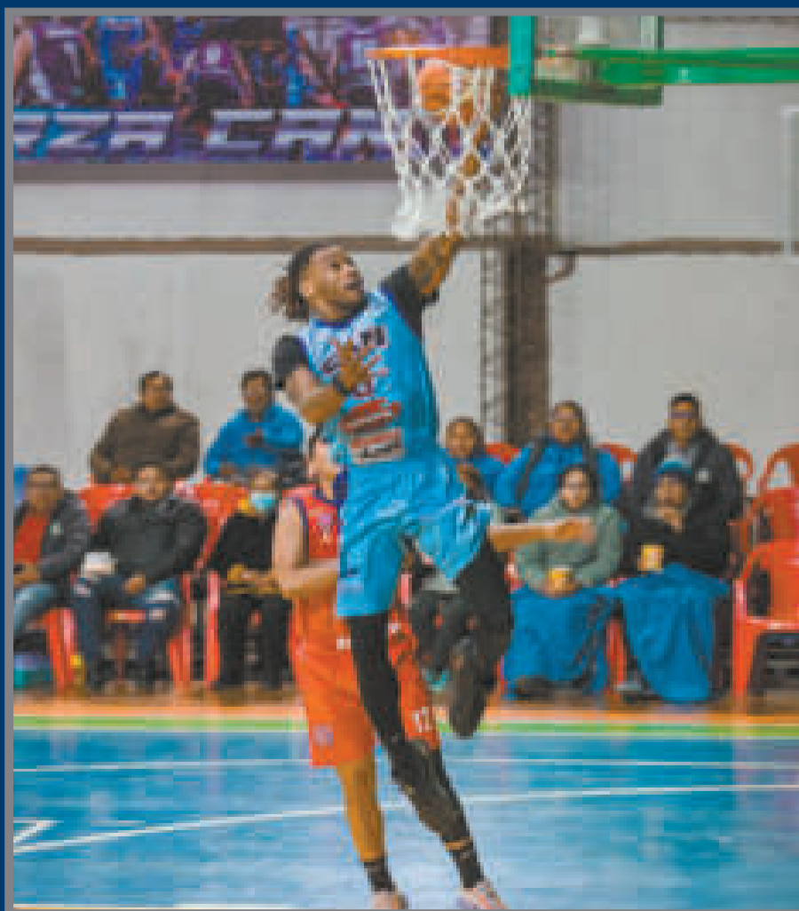
Una incidencia del partido que ganó el club CAN a Universitario, en Oruro.