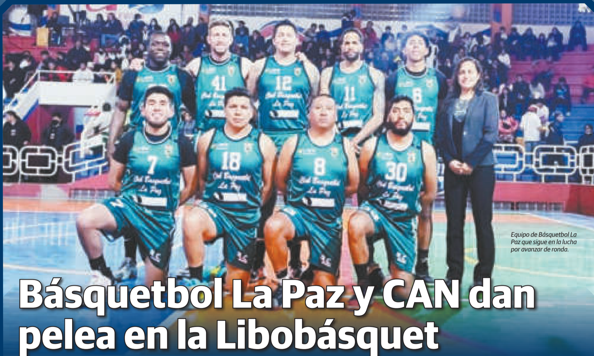
Equipo de Básquetbol La Paz que sigue en la lucha por avanzar de ronda.