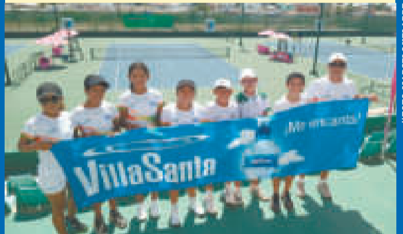
Tenistas seleccionados para competir en el Sudamericano Sub-12.

Al final los primeros de cada grupo se enfrentarán por el título, los segundos por el tercer puesto; los terceros por el quinto; los cuartos por el séptimo; y los quintos por el noveno.