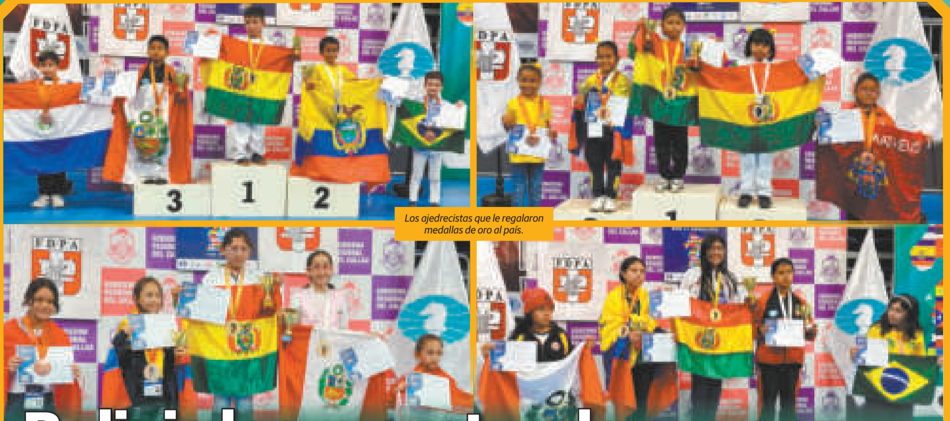
Los ajedrecistas que le regalaron medallas de oro al país.