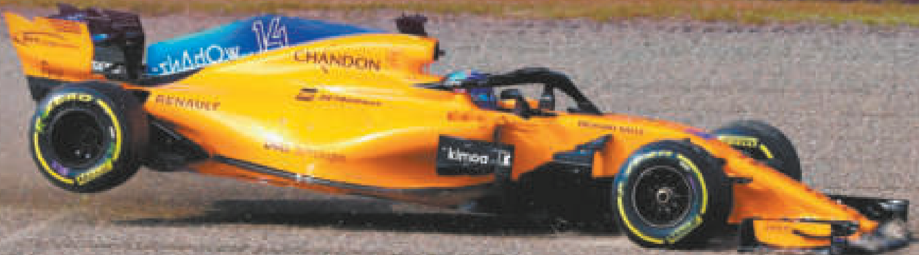
El coche de Fernando Alonso fuera de la pista después de romper motor.

El gran circo continuará en Norteamérica y el venidero fin de semana se llevará a cabo el Gran Premio de México en el Autódromo Hermanos Rodríguez de la capital azteca.