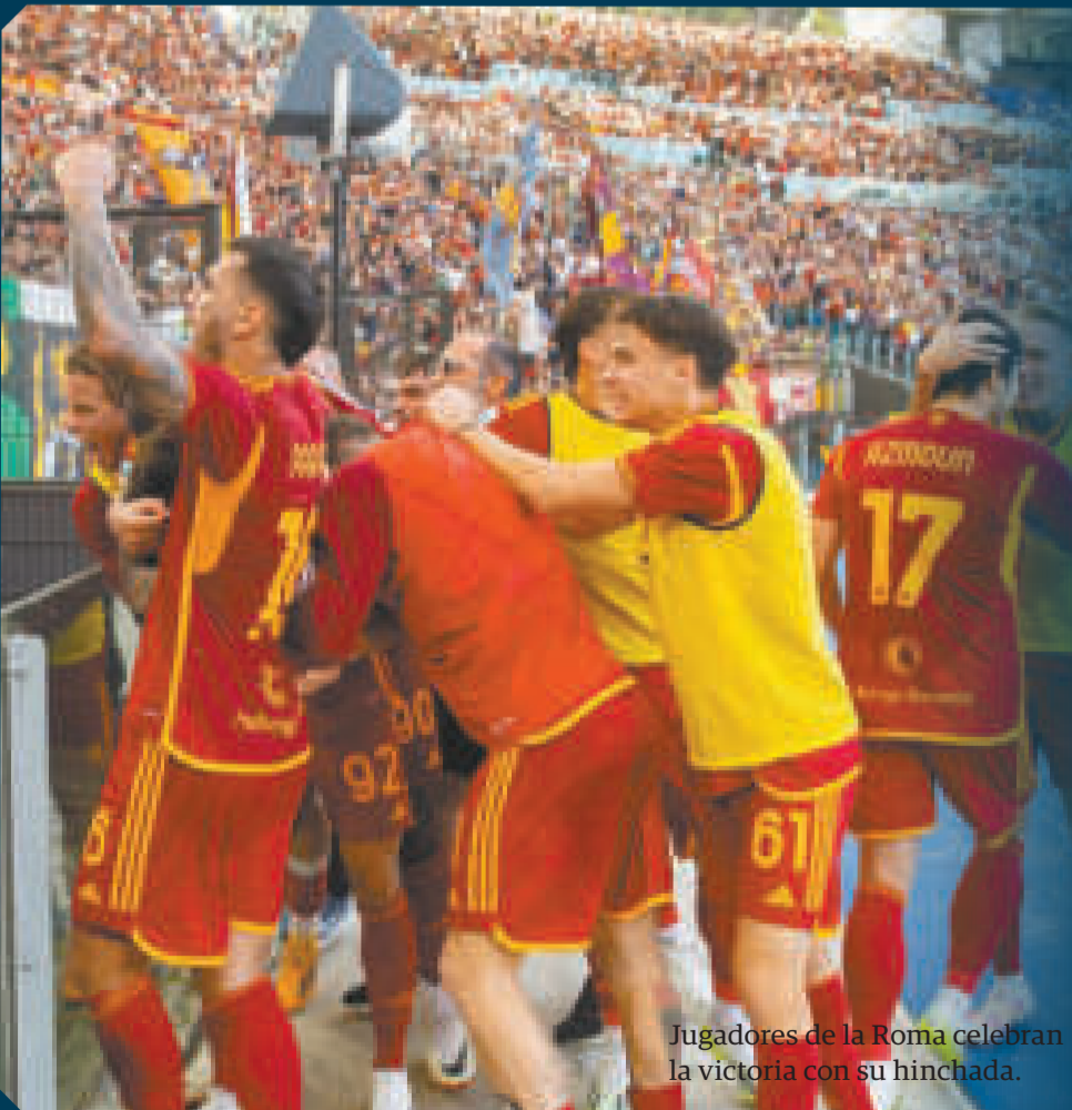
Jugadores de la Roma celebran la victoria con su hinchada.