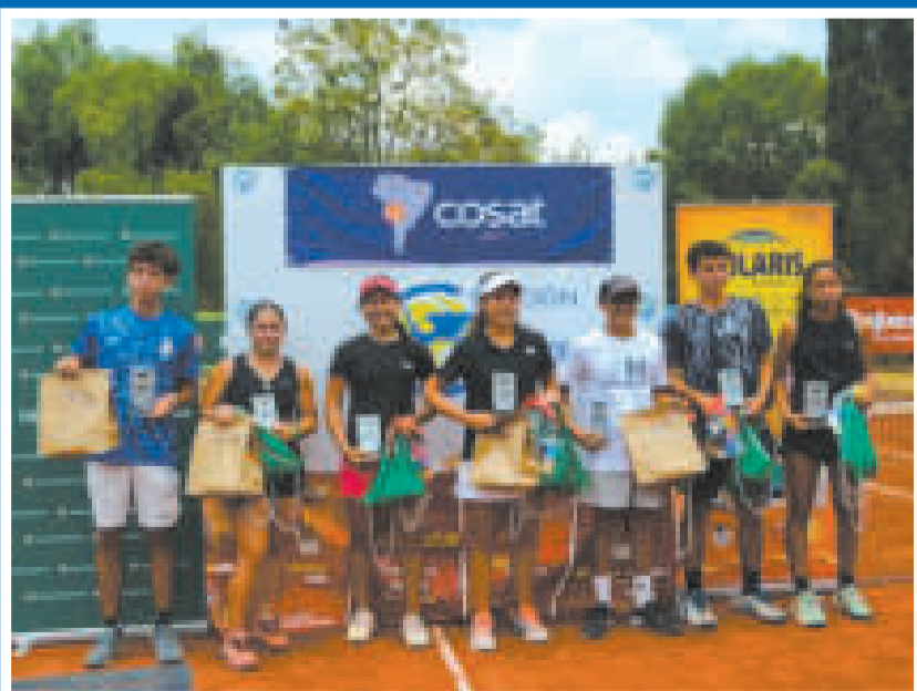
Los tenistas que lograron los primeros lugares en el Cóndor de Plata de Cochabamba.

B olivia conquistó tres títulos y dos subcampeonatos en el Cóndor de Plata de la Gira Cosat para Sub-16 y Sub-14, damas y varones, que se disputó en Cochabamba.