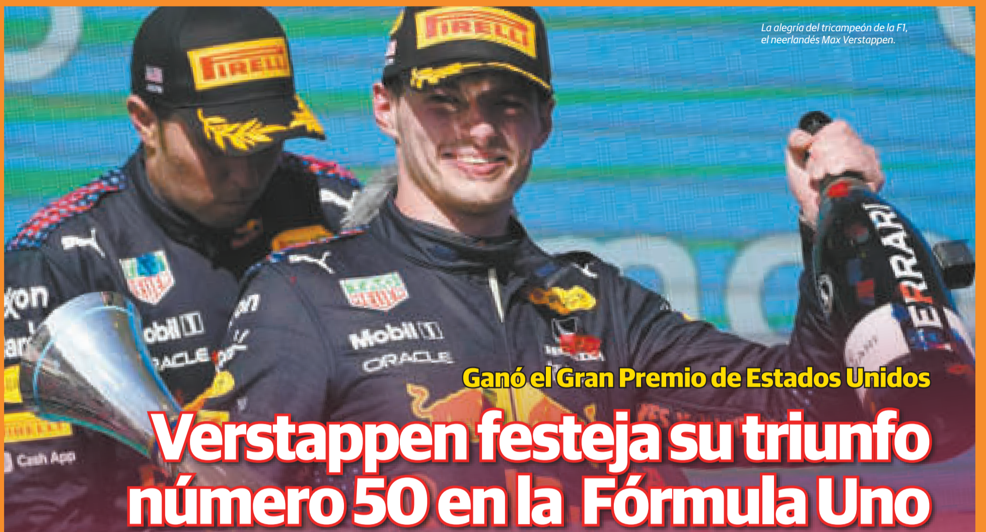
La alegría del tricampeón de la F1, el neerlandés Max Verstappen.