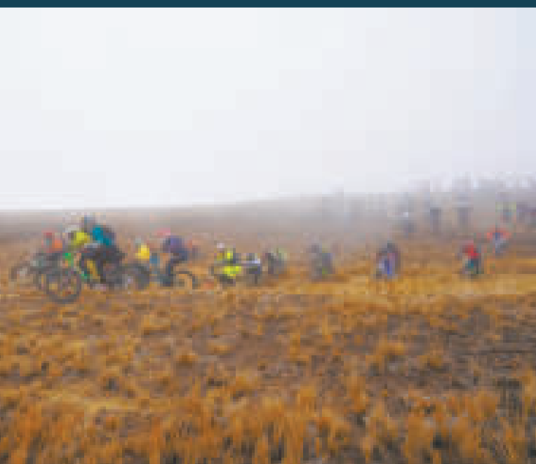
Los participantes en plena competencia en la población de Sorata.