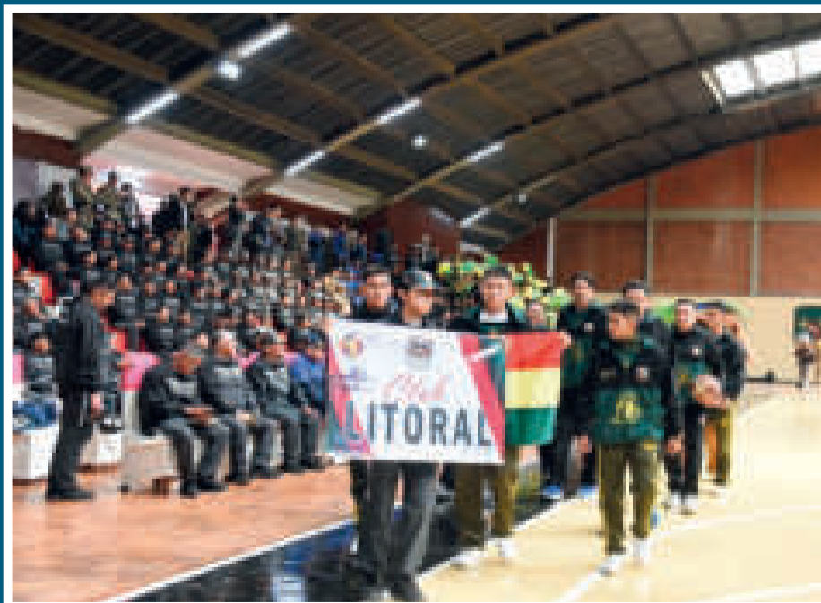
El club Litoral, que representa la Policía Boliviana, en el desfile inaugural del certamen.