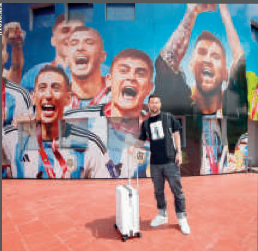
Lionel Messi cuando ingresa a la concentración de la selección argentina en Ezeiza.

El capitán del seleccionado argentino, Lionel Messi, llegó al país para afrontar la última doble fecha del año de las Eliminatorias Sudamericanas del Mundial 2026 que incluye los clásicos ante Uruguay y Brasil.