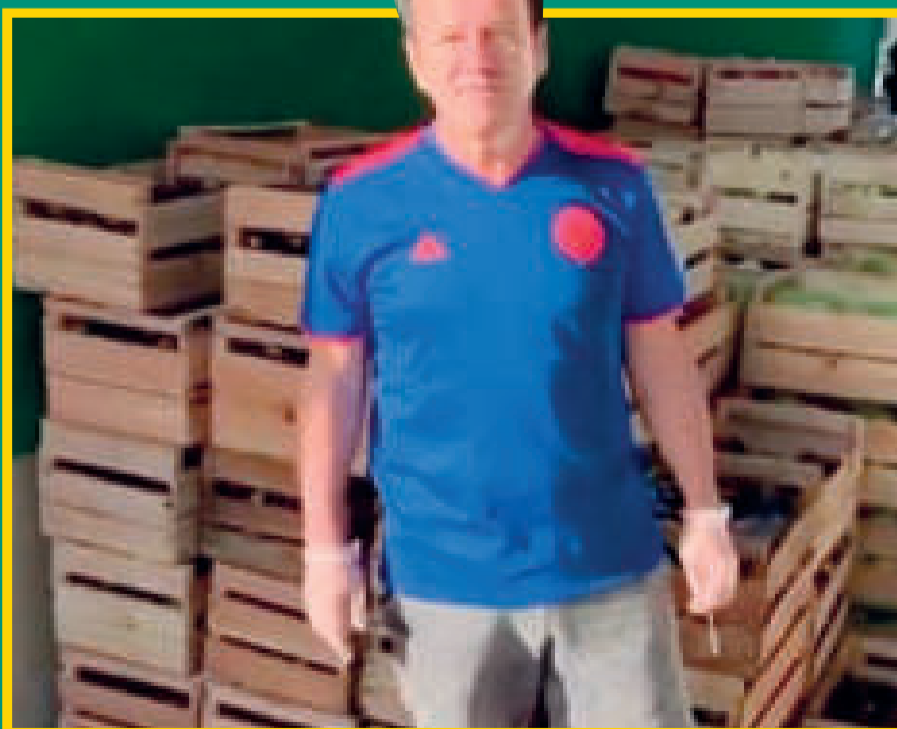
Dunga, recolecta y compra comida para entregar a la gente de la calle.

Exitoso en su carrera como futbolista y, en cierto modo también como entrenador, hoy, a los 60 años, Dunga recibe el mejor de los reconocimientos, el de la gente que recibe la ayuda de su solidaridad. (TN.COM).