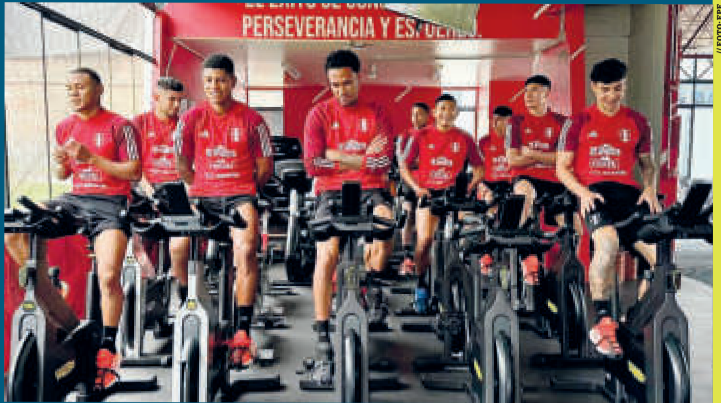
Jugadores de la selección peruana en plena tarea de potenciación muscular.

Bolivia, por su parte, llega a este partido después de caer por 0-1 ante la selección de Paraguay en el estadio Defensores del Chaco, por la cuarta jornada de las Eliminatorias. El equipo altiplánico no ha sumado un solo punto y buscará obtener su primer triunfo ante Perú en casa.