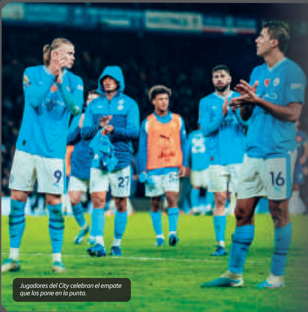
Jugadores del City celebran el empate que los pone en la punta.

Con su doblete, Haaland llegó a 13 goles en la Premier, líder por delante del egipcio Mohamed Salah (10), que también marcó dos dianas en el éxito del Liverpool sobre Brentford.