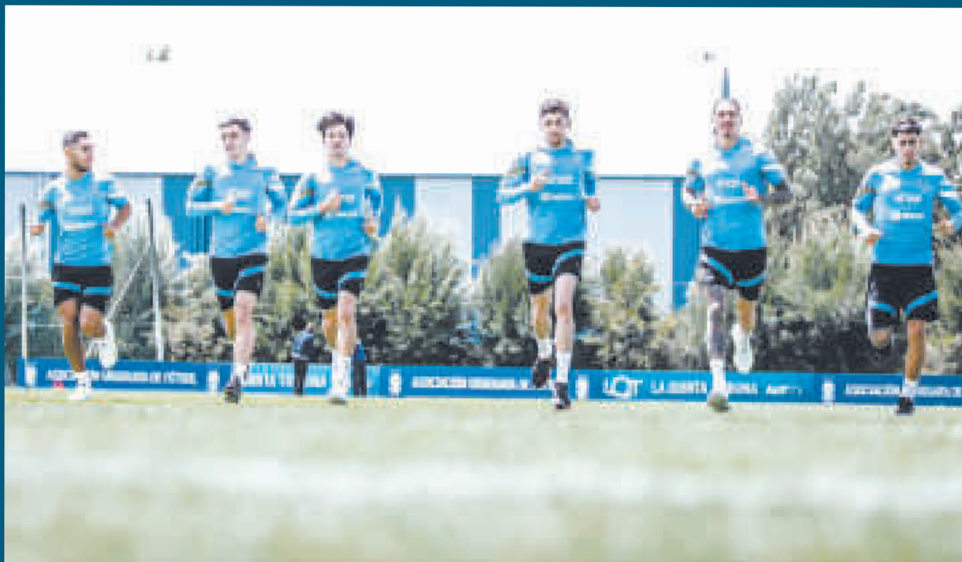
Jugadores de la selección uruguaya en plena tarea de calentamiento físico.

Consultado por el seleccionador Marcelo Bielsa, valoró que "es un entrenador que tiene las cosas muy claras". "Nos pide que la presión la hagamos