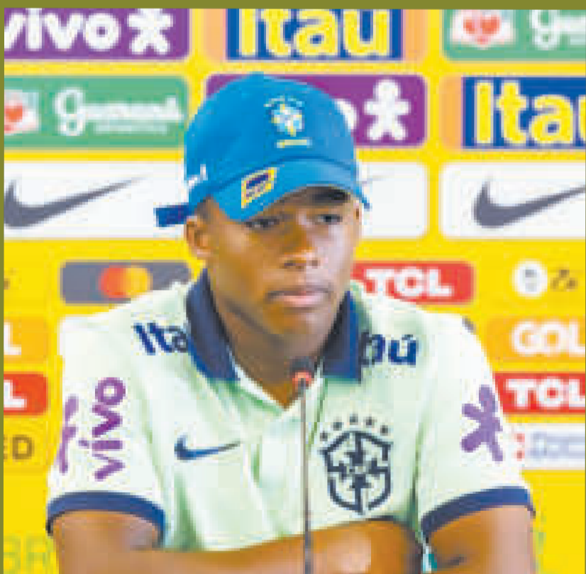
Endrick, uno de los futbolistas más jóvenes del equipo brasileño, podría debutar ante Argentina.

E l seleccionado de Brasil contará con la vuelta del delantero Gabriel Jesús para enfrentar a la Argentina mañana en el estadio Maracanã de Río de Janeiro por las Eliminatorias Sudamericanas, según la práctica que cumplió la Canarinha en su centro deportivo, la Granja Comary.