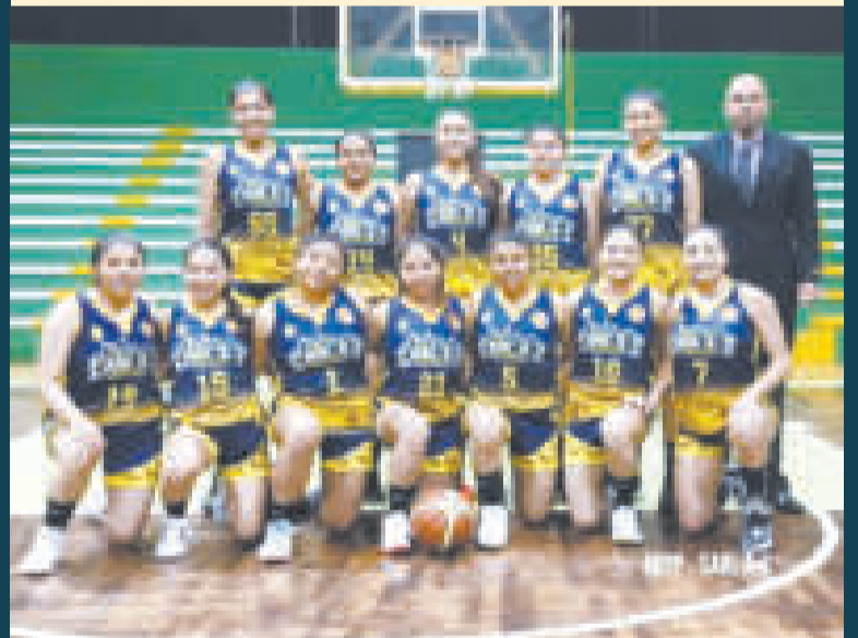
Equipo de CARL A-Z arrancó con triunfo la ronda semifinal de la Libofem.

En caso de repetirse los ganadores del primer encuentro, no habrá necesidad de disputar el tercer cotejo. Caso contrario, el partido definitivo se celebrará el 25 de noviembre con CTLP y San Simón, que volverán a ser locales.