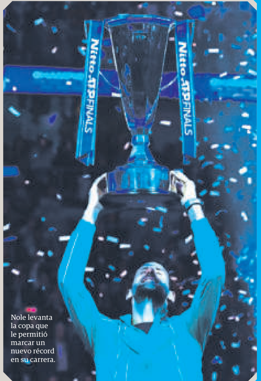
Nole levanta la copa que le permitió marcar un nuevo récord en su carrera.

El italiano reaccionó en el segundo parcial y encendió nuevamente a los fanáticos, que habían quedado en silencio por la potencia del serbio, resistiendo dos bolas de quiebre en un séptimo juego que se alargó 15 minutos y que dejó el parcial 4-3. Sin embargo, el joven no pudo detener mucho más a Nole Djokovic y en su siguiente servicio perdió el partido tras una doble falta.