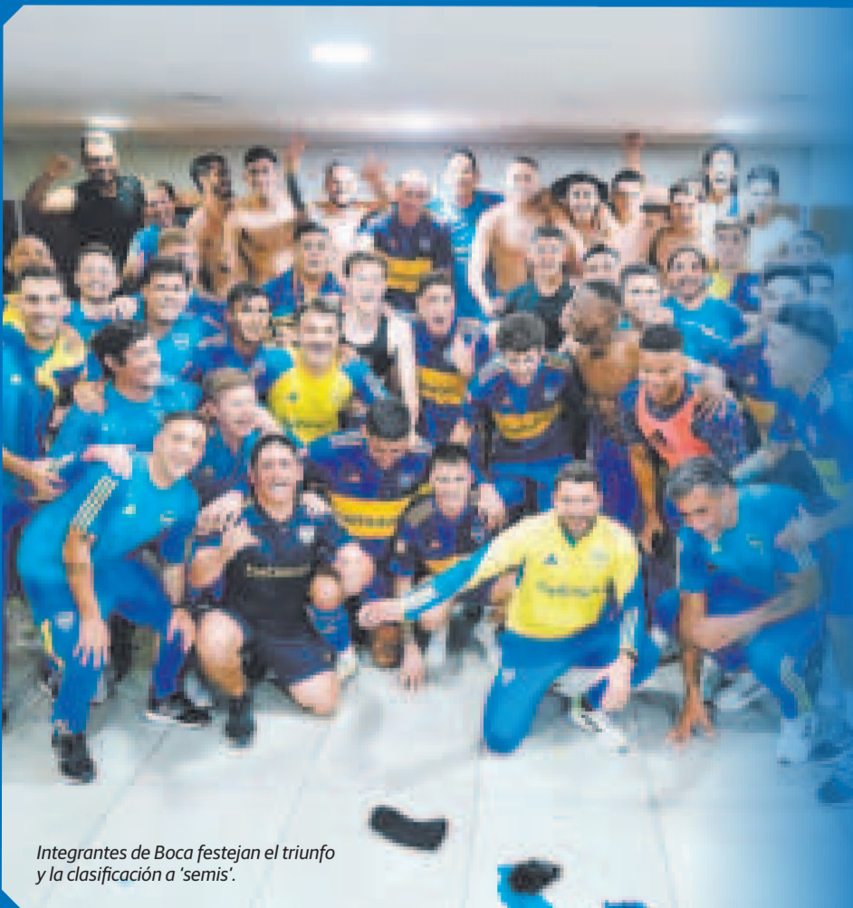
Integrantes de Boca festejan el triunfo y la clasificación a 'semis'.