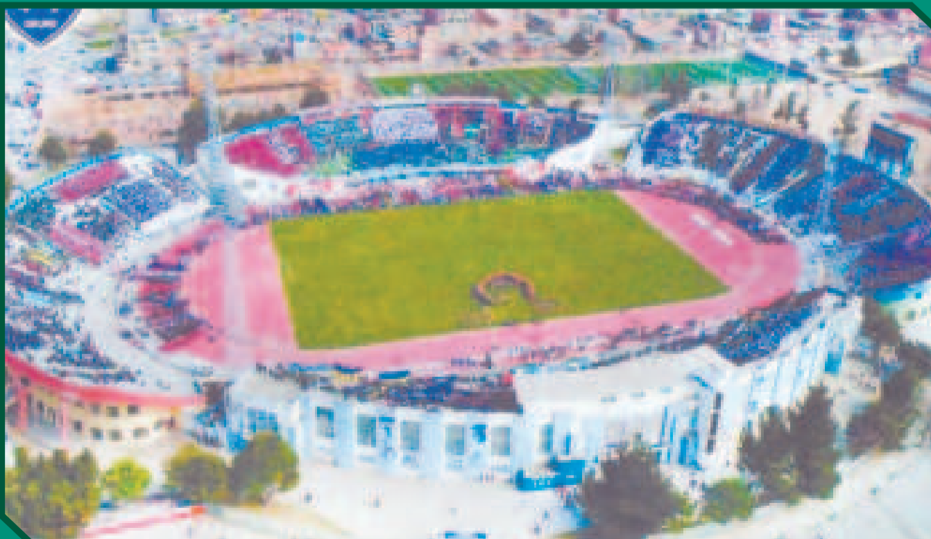
El estadio Jesús Bermúdez es otra alternativa para que la Verde sea local.

No se descarta que, en adelante, los estadios de Santa Cruz y Cochabamba tengan la posibilidad de recibir cotejos oficiales y de preparación de la Selección nacional.