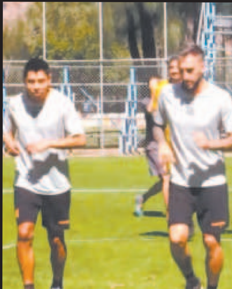
Jugadores del Tigre en un trabajo regenerativo en la parte física en Cochabamba.

Al día siguiente del compromiso copero, la representación del elenco gualdinegro retornará a La Paz para preparar el cotejo de vuelta de la semifinal del certamen doméstico contra el plantel cochabambino, que se jugará el domingo en el estadio Hernando Siles desde las 16.00.