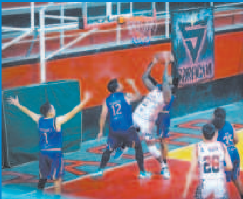
Una incidencia del partido jugado entre los equipos orureños de Saracho y CAN.