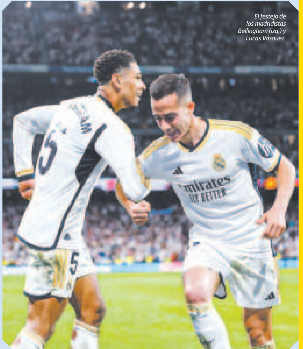
El festejo de los madridistas Bellingham (izq.) y Lucas Vázquez.

Todo parecía encaminado al empate, pero en el tiempo añadido Lucas seguía con fuerza para internarse por la derecha y poner un balón al área, ante el que Joselu amagó y su decisión permitió que Bellingham fusilara la portería contraria, a Ter Stegen y a la Liga.