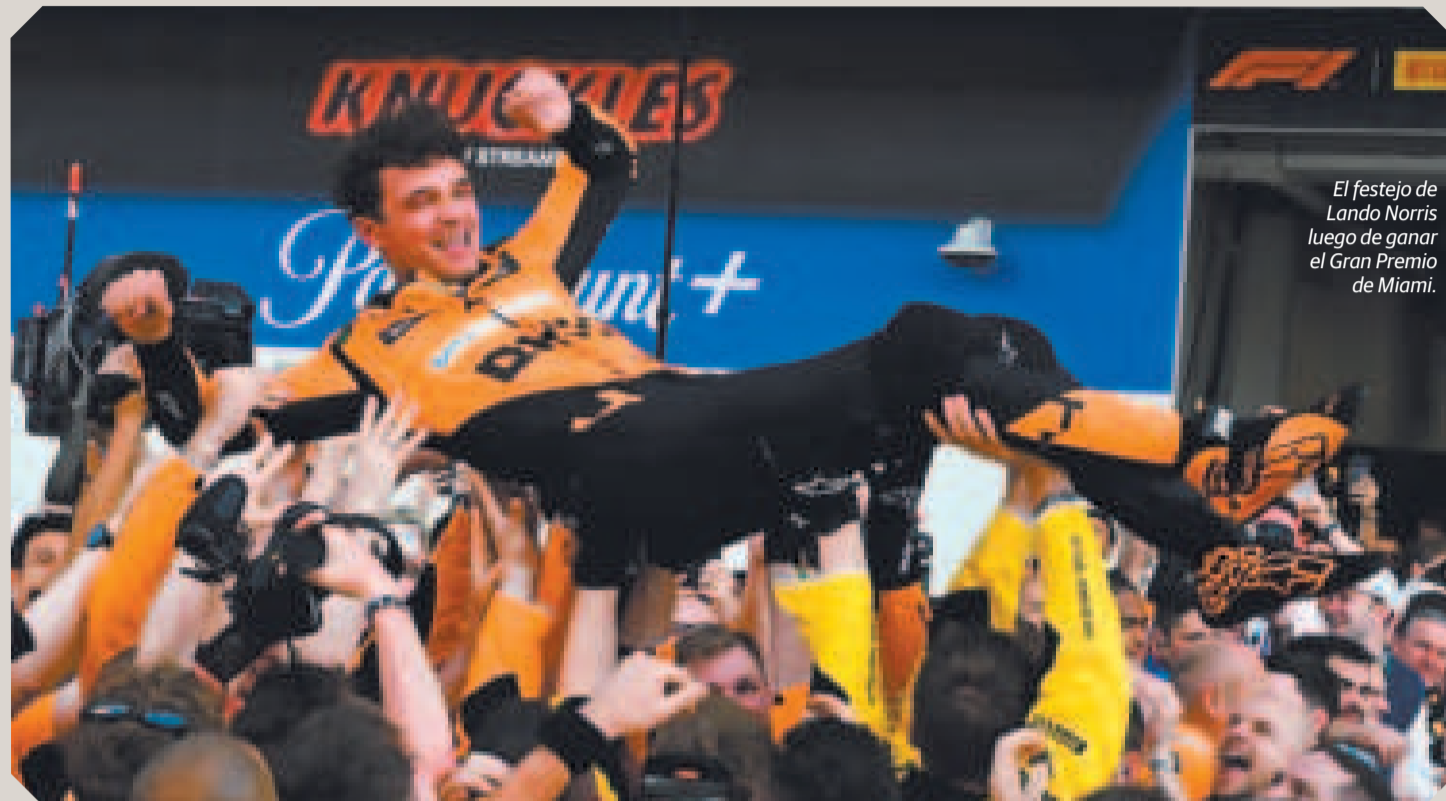
El festejo de Lando Norris luego de ganar el Gran Premio de Miami.

En el relanzamiento hubo emoción ya que Max, que había vuelto a pista en la cuarta posición con el ingreso a