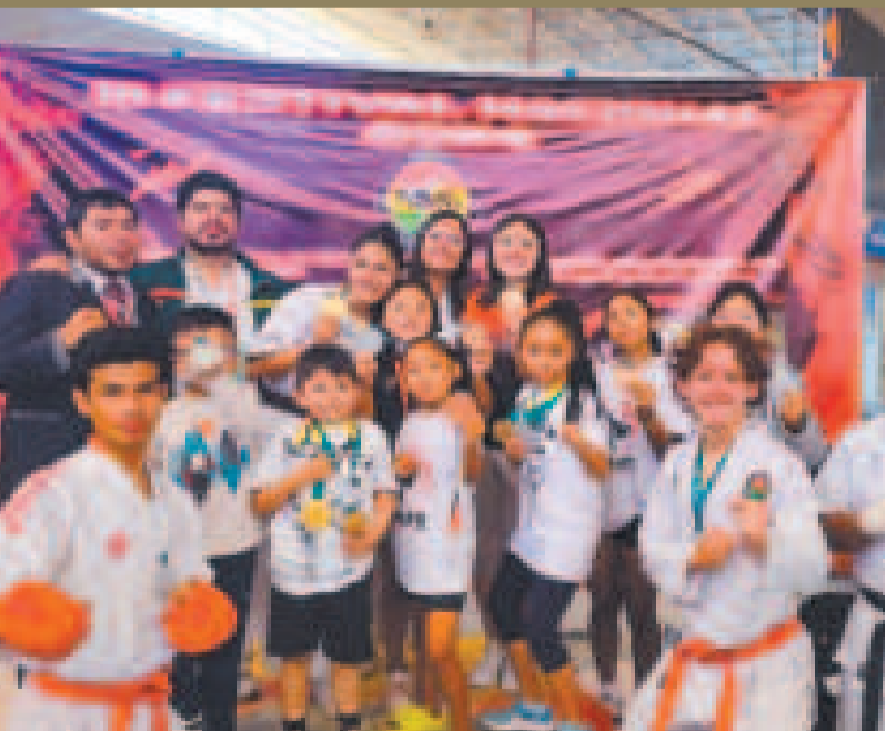
Deportistas de la delegación ganadora del Festival de Artes Marciales.