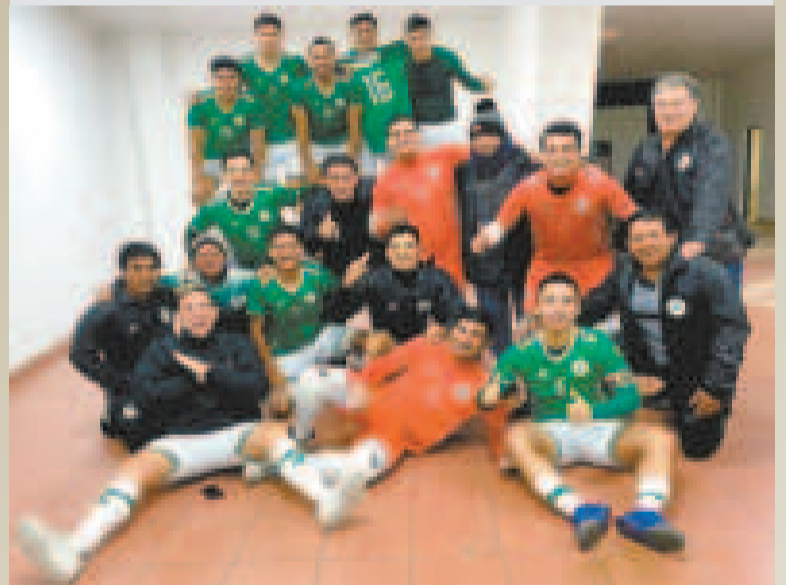
La celebración de los jugadores de CRE después de vencer a Córdoba.

El orureño Fantasmas Morales Moralitos ganó a Lizondo (9-6) en el Palacio de los Deportes, y de igual manera tiene 22 puntos. Adutoys derrotó al alteño Proyecto Redag en el Julio Borelli Viteritto (5-4) y, por último, Antofagasta de Sucre triunfó sobre el orureño Morales Moralitos (3-2) en el Jorge Revilla Aldana.