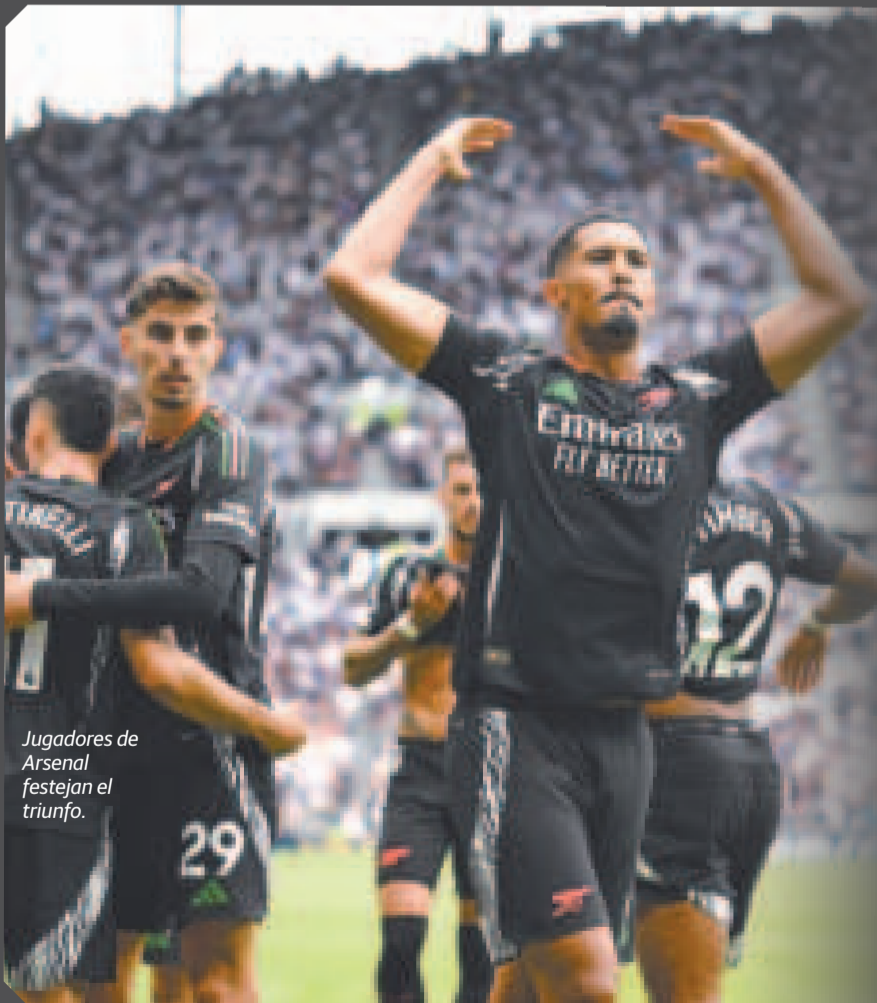
Jugadores de Arsenal festejan el triunfo.

Los de casa se adelantaron con un tanto de Mario Lamine al minuto 36 y ganaban a los 75, cuando el disparo de Fabian Schar empató el cotejo al desviarse en la cabeza de Craig Dawson y acabar en la red (m. 75).