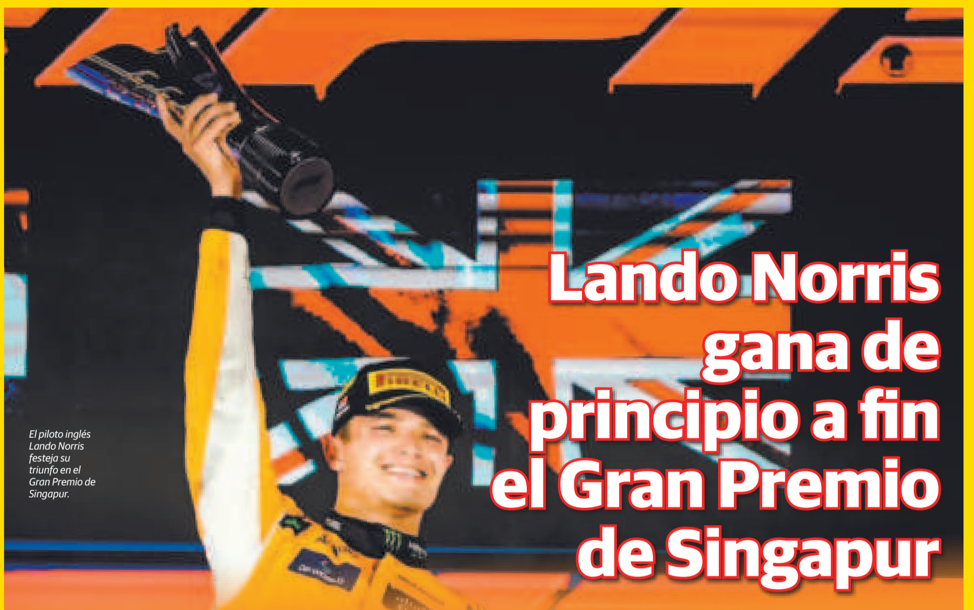
El piloto inglés Lando Norris festeja su triunfo en el Gran Premio de Singapur.