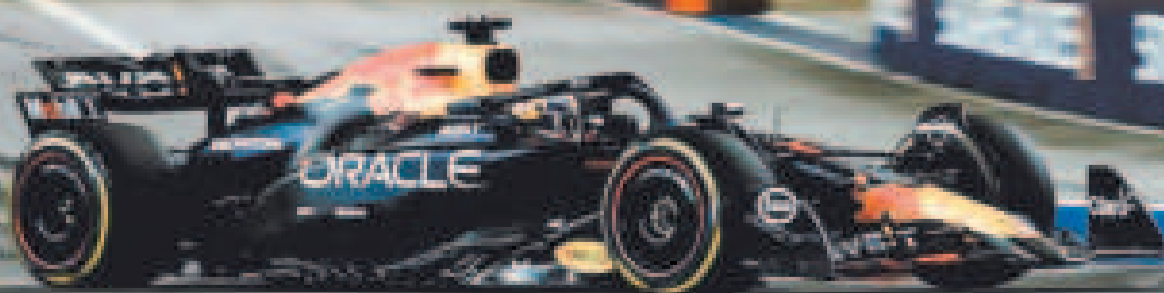
El coche de Max Verstappen en plena competencia en Singapur.

El Mundial se reanuda con el Gran Premio de Estados Unidos, que se disputará el 20 de octubre en el Circuito de las Américas de Austin (Texas), primera parada de un 'tripleto' que se completará, las dos semanas siguientes, en México y en Brasil.