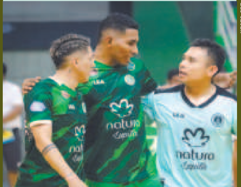
La celebración de los jugadores de Petrolero luego de vencer a Córdova.

Córdova perdió ante el yacuibeno Petrolero (3-1) en el Margoth Quevedo. El potosino Concepción venció al bermejeño Deportivo Amistad (5-4), y La Prensa ganó al tarijeño Nantes (6-5).