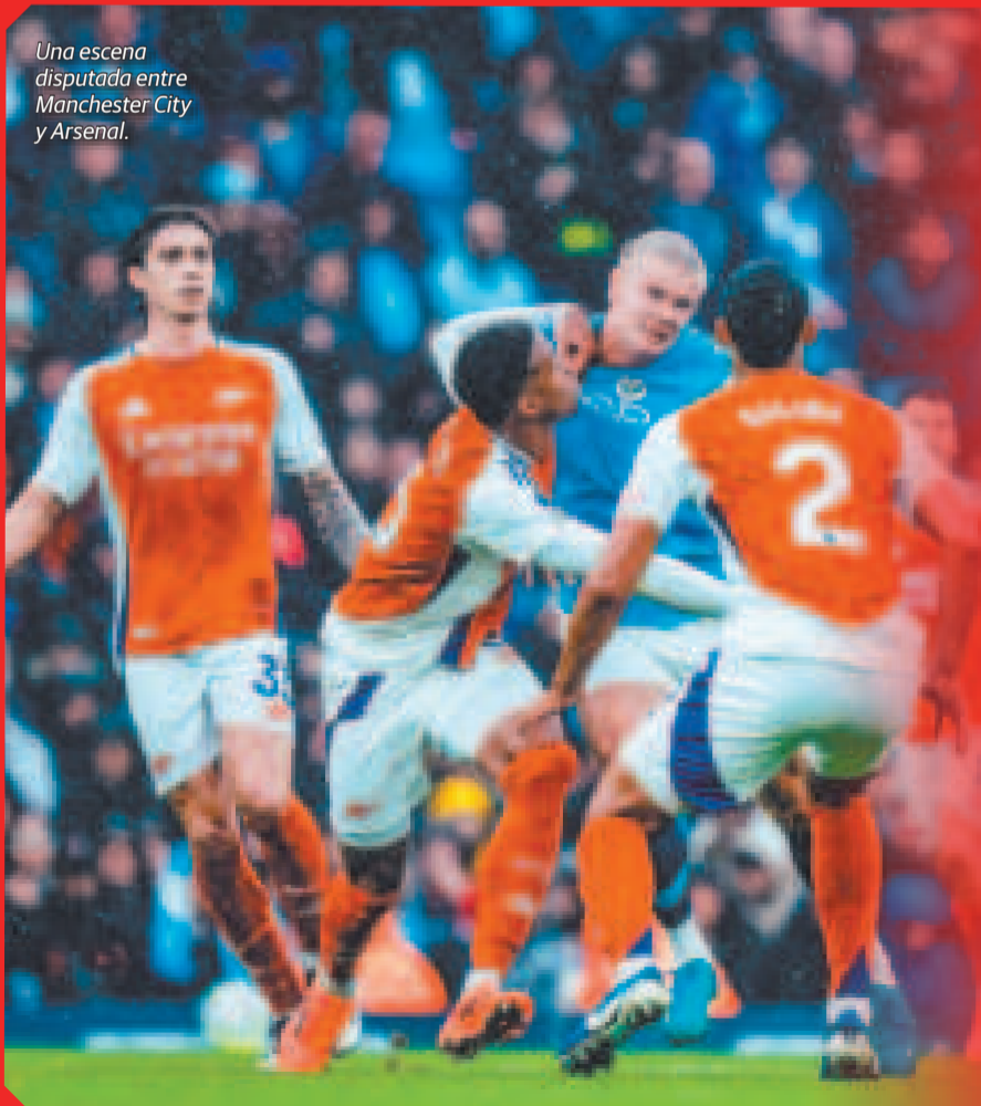
Una escena disputada entre Manchester City y Arsenal.