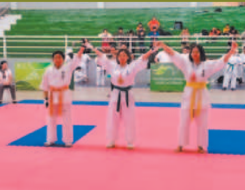
Karatas ganadoras de una de las categorías festejan el triunfo.

La dirigencia destacó el nivel que expusieron los deportistas en la competencia, que dejó buenas sensaciones y resultados.