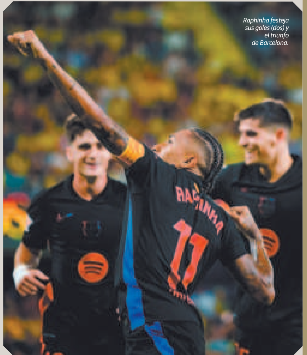
Raphinha festeja sus goles (dos) y el triunfo de Barcelona.

En otros resultados, Getafe igualó con Leganés 1-1, y Athletic de Bilbao venció 3-1 a Celta de Vigo.