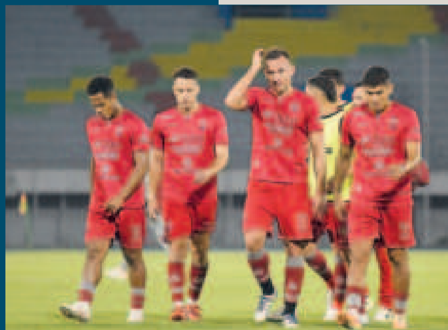
La desazón de los jugadores de Guabirá después de la derrota ante Aurora, en Cochabamba.

Aurora alcanzó la tercera posición en la tabla acumulada, donde tiene 40 puntos, quedó con el boleto en la mano a un torneo internacional, aunque perseguido por Gualberto Villarroel San José, que tiene 38. Entretanto, Guabirá está antepenúltimo en la tabla, a tres unidades de ser alcanzado por Royal Pari, comprometido con el descenso indirecto.