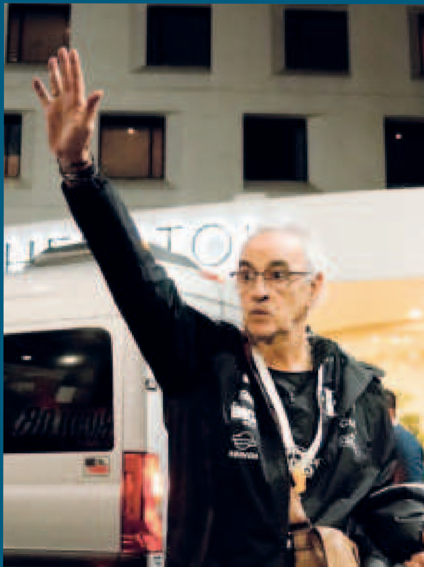
Jorge Fossati, técnico del seleccionado peruano que atraviesa un momento difícil.

Bajo el mando del técnico Jorge Fossati, el equipo ha tenido algunos buenos resultados en amistosos, pero su desempeño en torneos oficiales ha sido inconsistente.