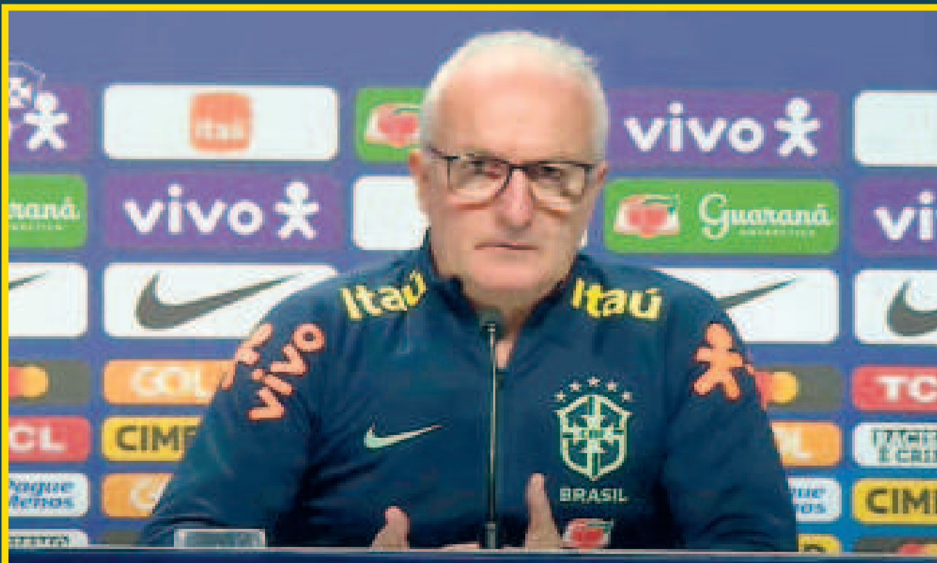
Dorival Júnior, entrenador del seleccionado brasileño, habló de los jugadores Neymar y Vinicius.

"Y seguimos con estas exigencias, y a veces en la selección no sucede, hay otros que en la selección se desviven y juegan mucho más que en los clubes. Tenemos que estar tranquilos, para que podamos esperar el momento en que todo florezca. Es natural que todos se preocupen, siempre estamos hablando, buscando soluciones", añadió el DT.