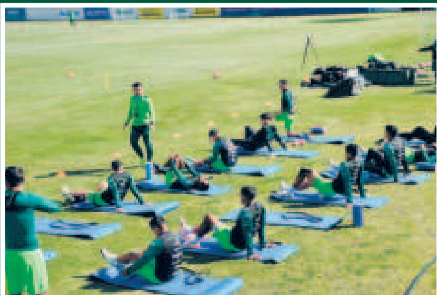
Los seleccionados en la sesión de calentamiento con ejercicios variados.

El equipo nacional proseguirá hoy con su labor preparatoria en un escenario por definir.