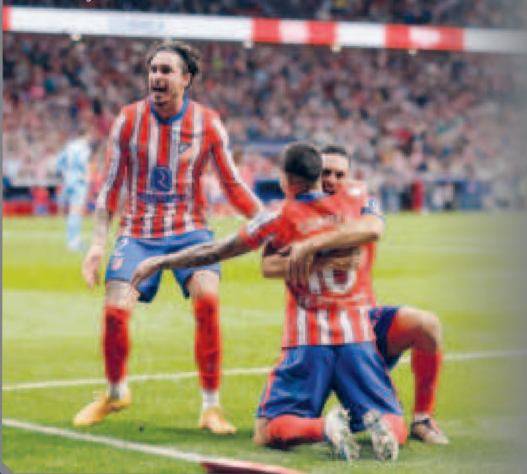
Integrantes del Atlético celebran la igualdad.