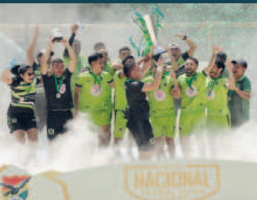
Jugadores de Palma Verde festejan el título conseguido en fútbol playa.