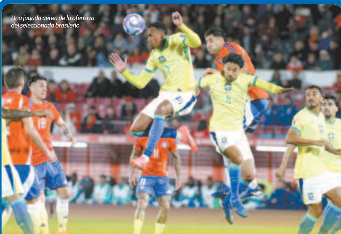
Una jugada aérea de la ofensiva del seleccionado brasileño.