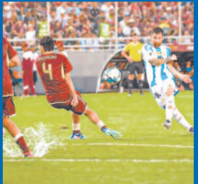
El argentino Lionel Messi remata ante dos defensores venezolanos.