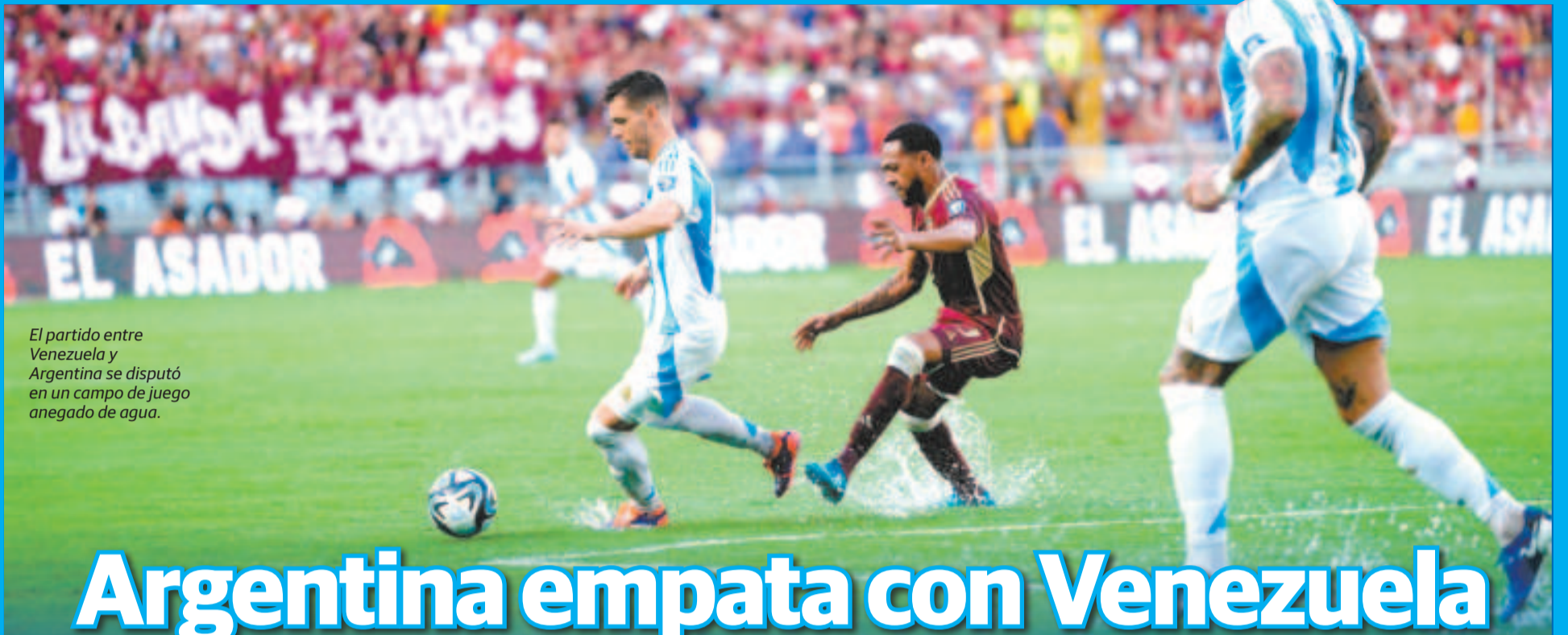
El partido entre Venezuela y Argentina se disputó en un campo de juego anegado de agua.