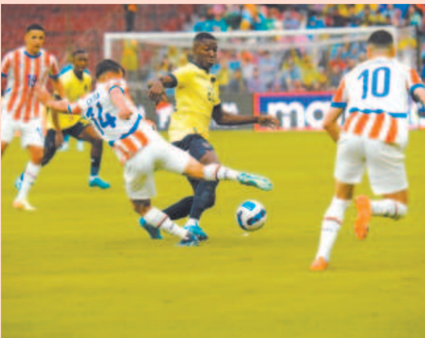
Una incidencia del encuentro jugado en Quito entre Ecuador y Paraguay.