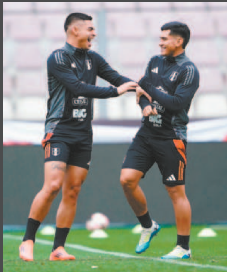
Seleccionados peruanos esperan optimistas el duelo contra Uruguay.

Uruguay: Sergio Rochet; Guillermo Varela, Manuel Ugarte, Santiago Bueno; Nahitan Nández, Federico Valverde, Emiliano Martínez, Maximiliano Araújo; Giorgian De Arrascaeta; Facundo Pellistri y Darwin Núñez. DT: Marcelo Bielsa.