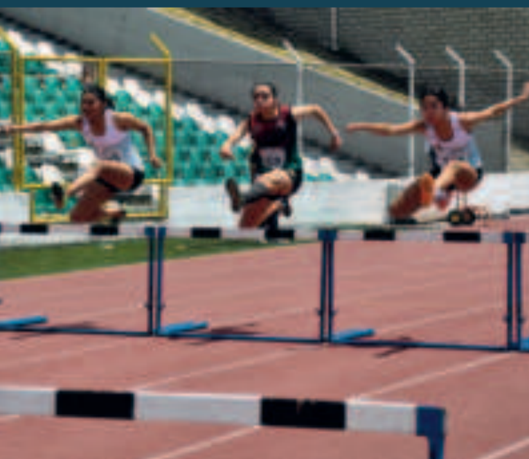
Las atletas en una de las pruebas con vallas.