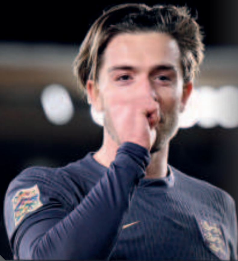
El inglés Jack Grealish festeja su gol, el primero de su selección.