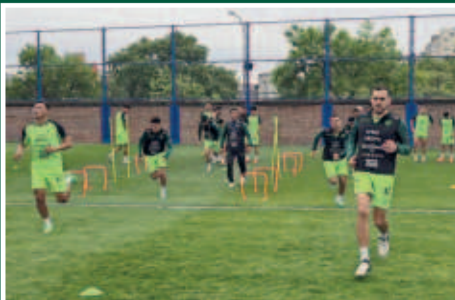
El entrenamiento vespertino arrancó con una sesión física.

La Selección se entrenó ayer a puertas cerradas en Casa Amarilla.