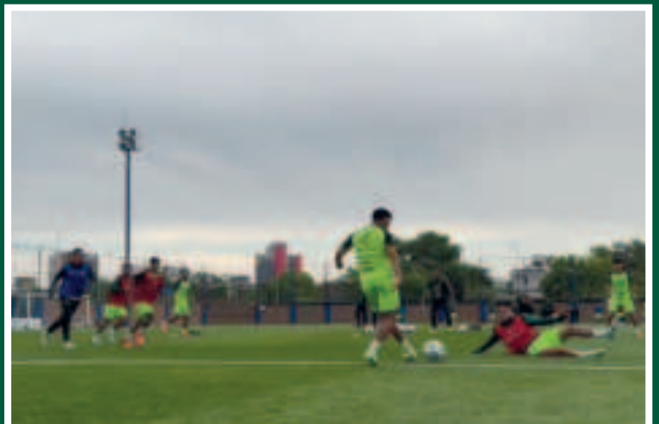
Una práctica de fútbol en espacio reducido.