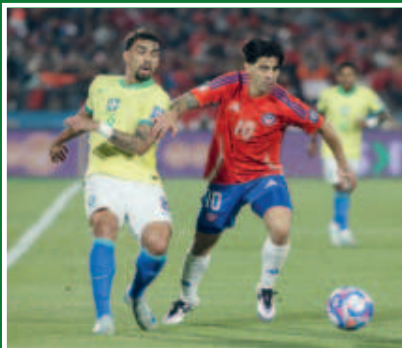
El presidente brasileño pidió que no se convoque a jugadores que juegan en el exterior.