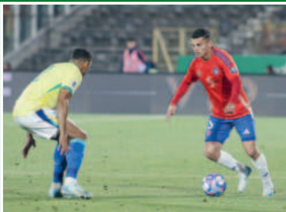
Una escena del partido que la selección brasileña le ganó a Chile.

Como bien apuntamos, todo esto está sucediendo antes de saber cómo quedará el partido entre la selección brasileña y Perú. Quizás lo dicho por Lula sea un golpe duro en el honor de los convocados y saquen su fuego interior. O simplemente estén enrasados, para demostrar que está completamente equivocado el presidente de la nación, sometiendo a La Blanquirroja de principio a fin. Ojalá que sea una gran noticia todo lo anterior para así celebrar un nuevo resultado a favor.