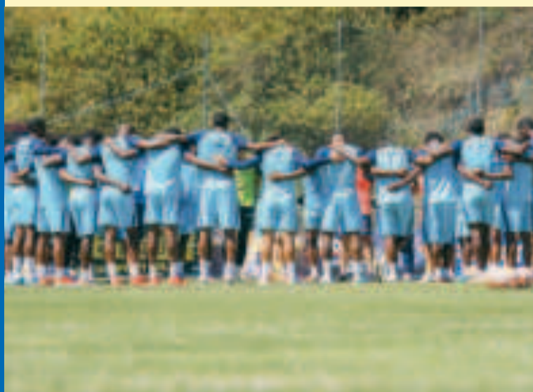
La selección ecuatoriana en la charla técnica previa a la práctica.

Añadió: "Fuera de la Selección no sé porque no convivo con él ni estoy en el club. Aquí se lo trata como uno más, no se siente sobre observado, se siente de manera natural, está feliz de jugar al fútbol".