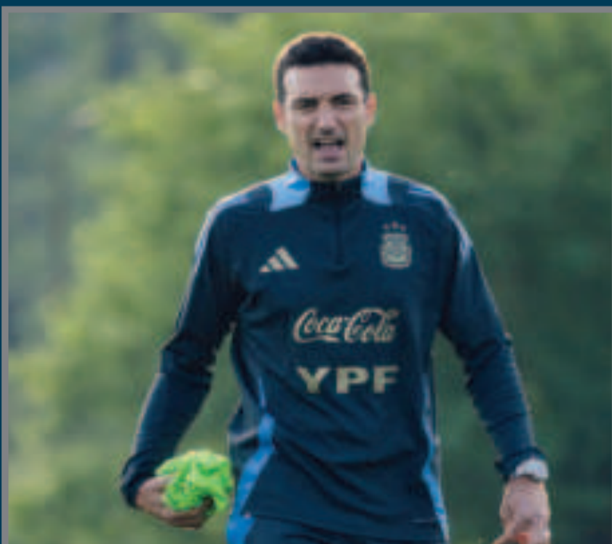
El técnico Lionel Scaloni supervisa la práctica del combinado albiceleste.

Mientras, el plantel campeón del mundo y de América disfruta de la convivencia casi familiar. De hecho, la mayoría de los jugadores (con Messi a la cabeza) y el cuerpo técnico estuvieron presenciando el amistoso del combinado Sub-20 que dirige Mascherano, que igualó 1-1 frente a Uzbekistán en una de las canchas del predio.