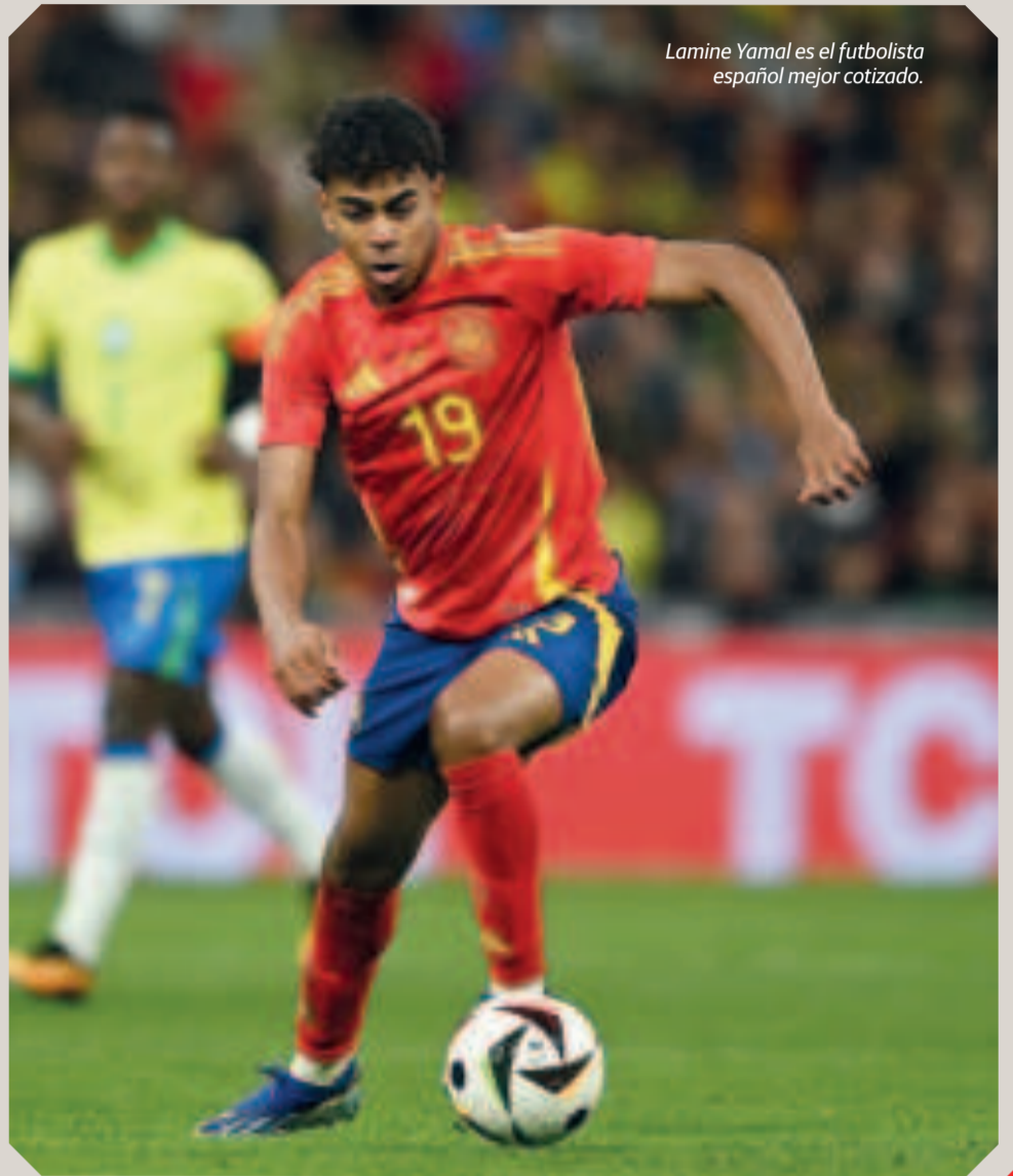
Lamine Yamal es el futbolista español mejor cotizado.

De esta manera, además de ser el español más valorado de todos los tiempos, Lamine Yamal se ha convertido en el segundo futbolista del Barça con una referencia más alta, solo por debajo de los 180 millones de euros que alcanzó Leo Messi en 2018 e igualando los 150 que tuvo en su momento (también en 2018) Philippe Coutinho y superando los 130 de Griezmann y los 120 de Dembélé.