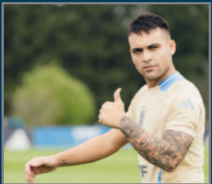
La confianza de Lautaro Martínez, delantero del seleccionado argentino.