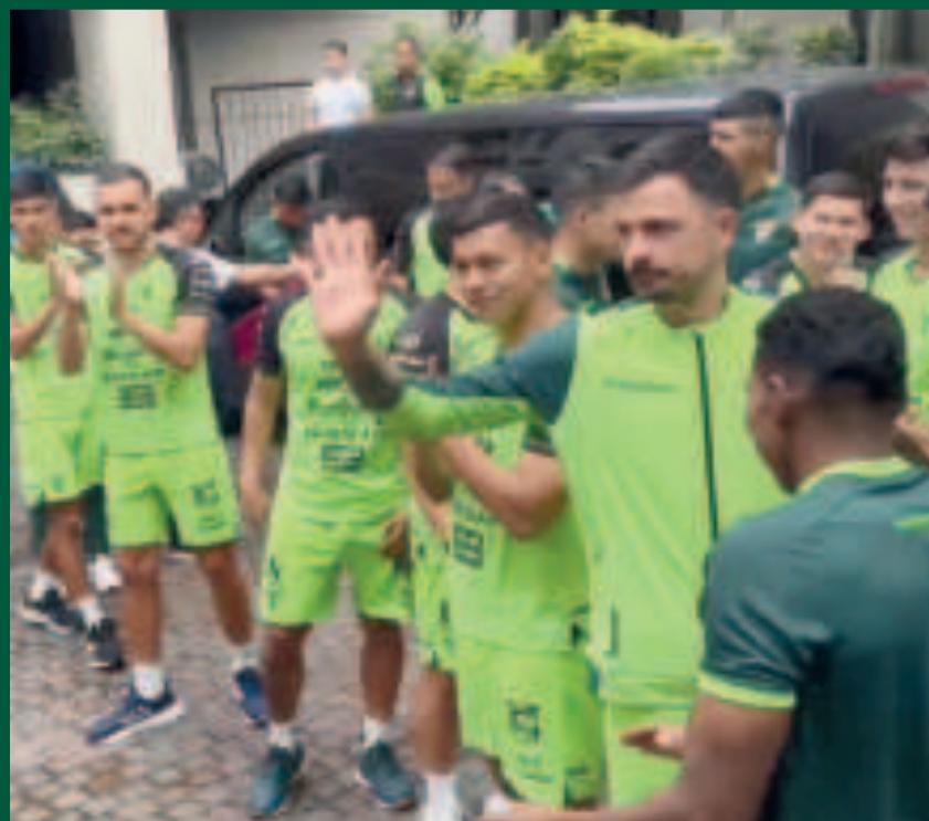
Jugadores del equipo nacional agradecen el respaldo de los aficionados.

Muchos de ellos ya han comprometido su asistencia al estadio de River para hacer escuchar su voz de aliento a la Selección.