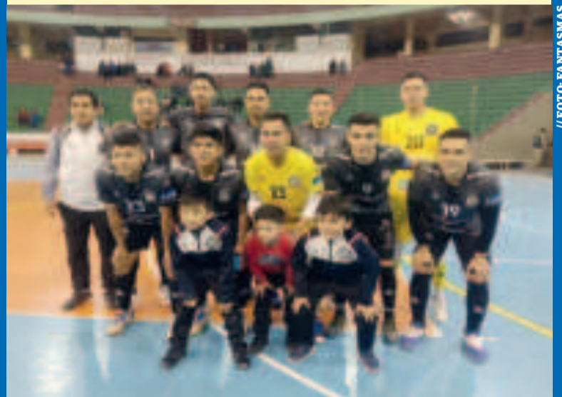
El equipo de Fantasmas Morales Moralitos tiene asegurado el pase a cuartos de final.

Por el Grupo B se disputaron los cuatro partidos de la decimotercera jornada. Adu toys ganó a Lizondo Singapur (7-3) en el Jorge Revilla Aldana, Víctor Muriel derrotó al orureño Morales Moralitos (7-2) en el Evo Morales, Fantasmas Morales Moralitos venció a Proyecto Redag (3-2) en el Julio Borelli Viteritto y Antofagasta se impuso sobre Wolf Sport (4-3) en el coliseo Julio Borelli.