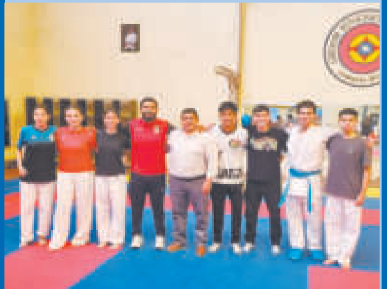
Karatecas que forman parte de la selección boliviana de la disciplina.

Agregó: "Sacaremos un reglamento de preparación y seguimiento a este equipo. Estamos a menos de tres meses de la competición y esto es producto de todo el seguimiento del año pasado; ha sido un proceso muy largo".