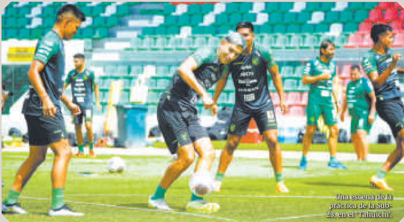
Una escena de la práctica de la Sub-23, en el 'Tahuichi'.

El equipo nacional se entrena con 28 futbolistas, porque ya dejaron la concentración Ronald Bustos (The Strongest),