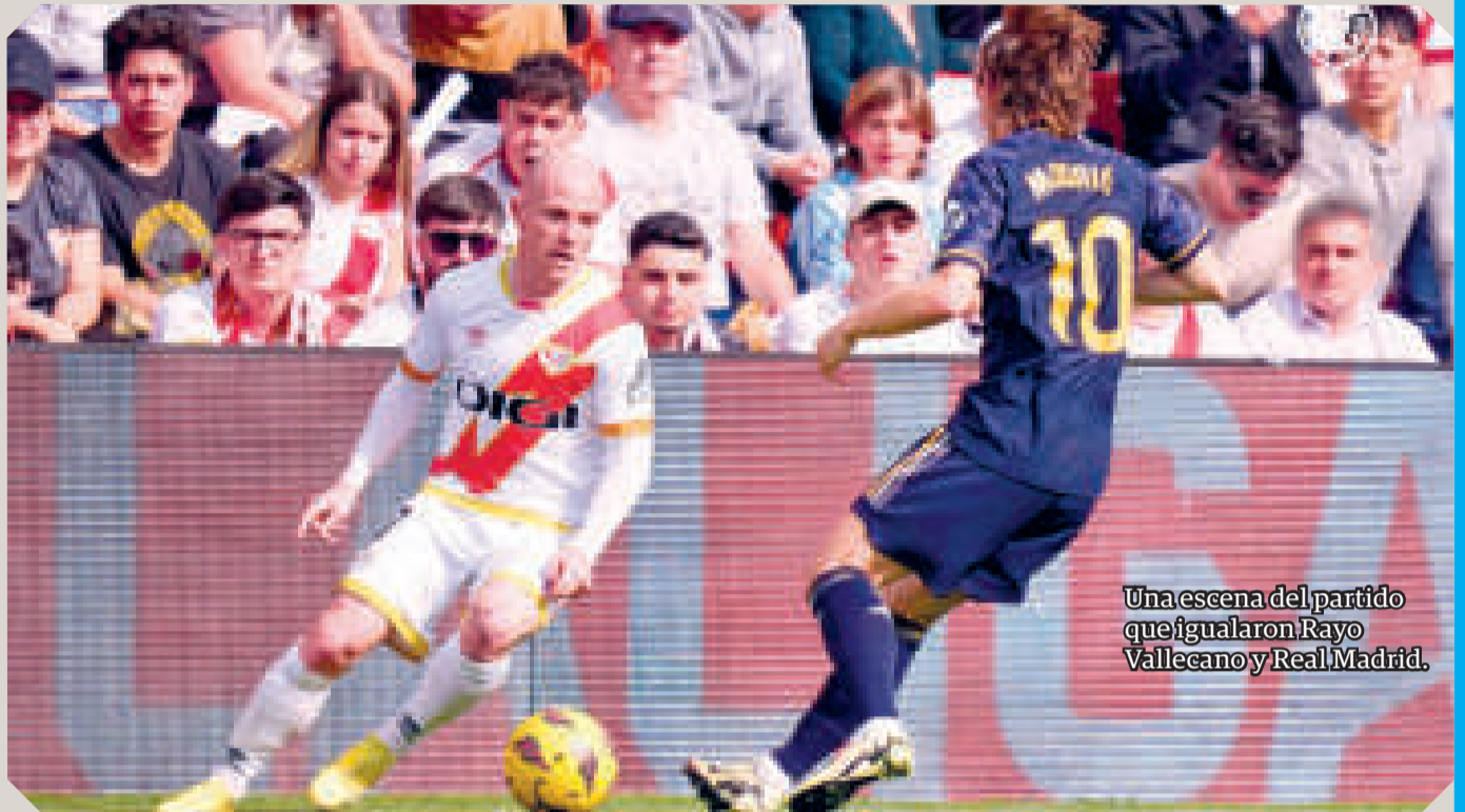
Una escena del partido que igualaron Rayo Vallecano y Real Madrid.

Los de Ancelotti estuvieron cerca de ponerse por delante en el 36'. Modrić sacó el córner, Aridane despejó de cabeza y Valverde aprovechó el rechazo para empalmar