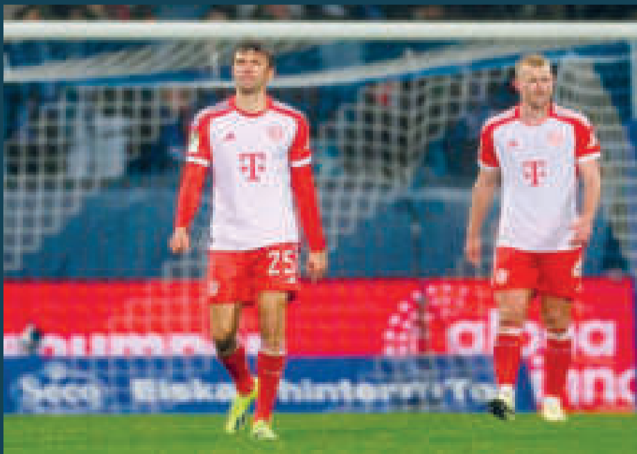
Jugadores del Bayern se retiran de la cancha cabizbajos por la derrota.