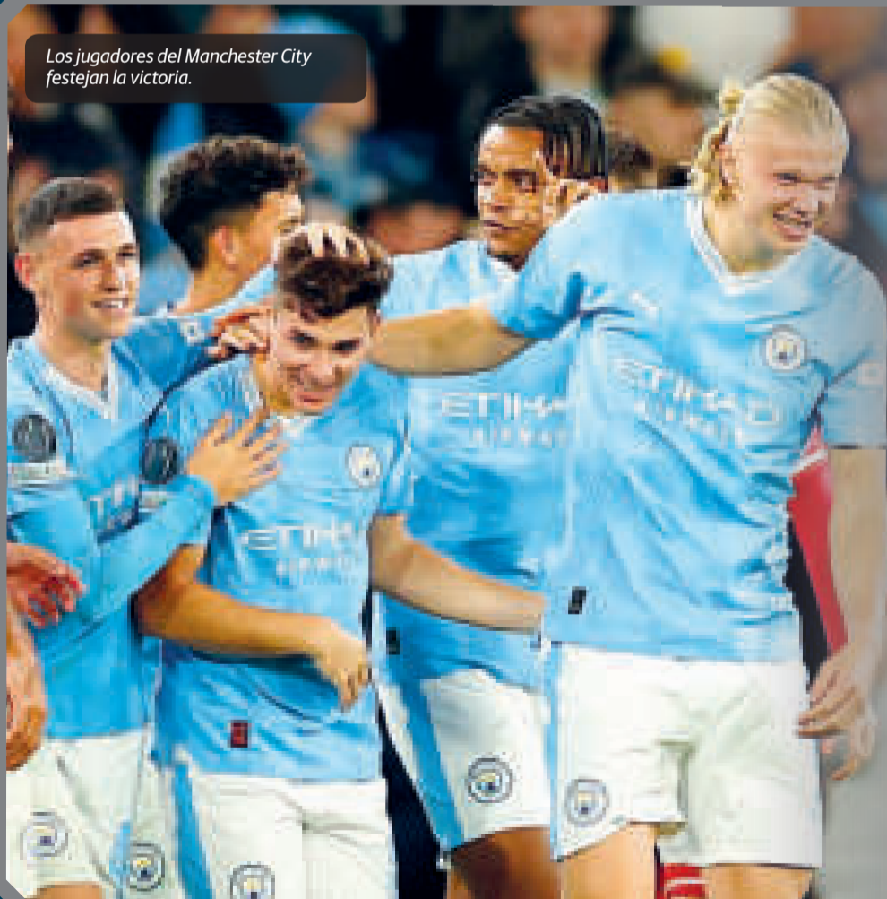
Los jugadores del Manchester City festejan la victoria.