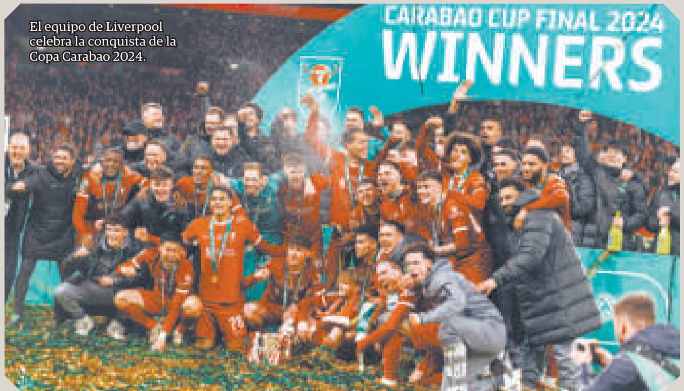
El equipo de Liverpool celebra la conquista de la Copa Carabao 2024.

Pero el zaguero central y capitán de los