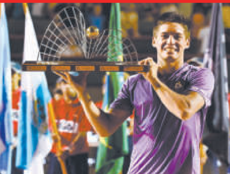
El argentino Sebastián Báez disfruta del trofeo que le dio como ganador del ATP 500