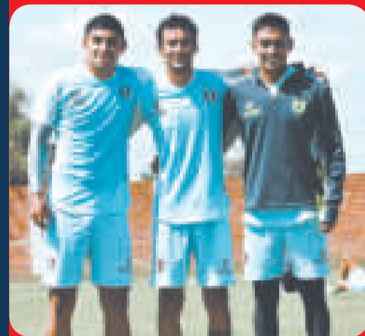
Jugadores de Real Tomayapo confían en ganar.