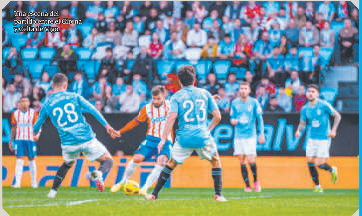
Una escena del partido entre el Girona y Celta de Vigo.

Con el triunfo, el Atlético llegó a 44 puntos y ancló en la tercera posición, empatado