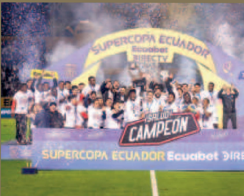
Liga Deportiva Universitaria festeja la conquista de la Supercopa de Ecuador.