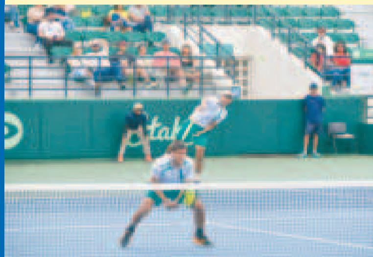
La dupla masculina de Bolivia.