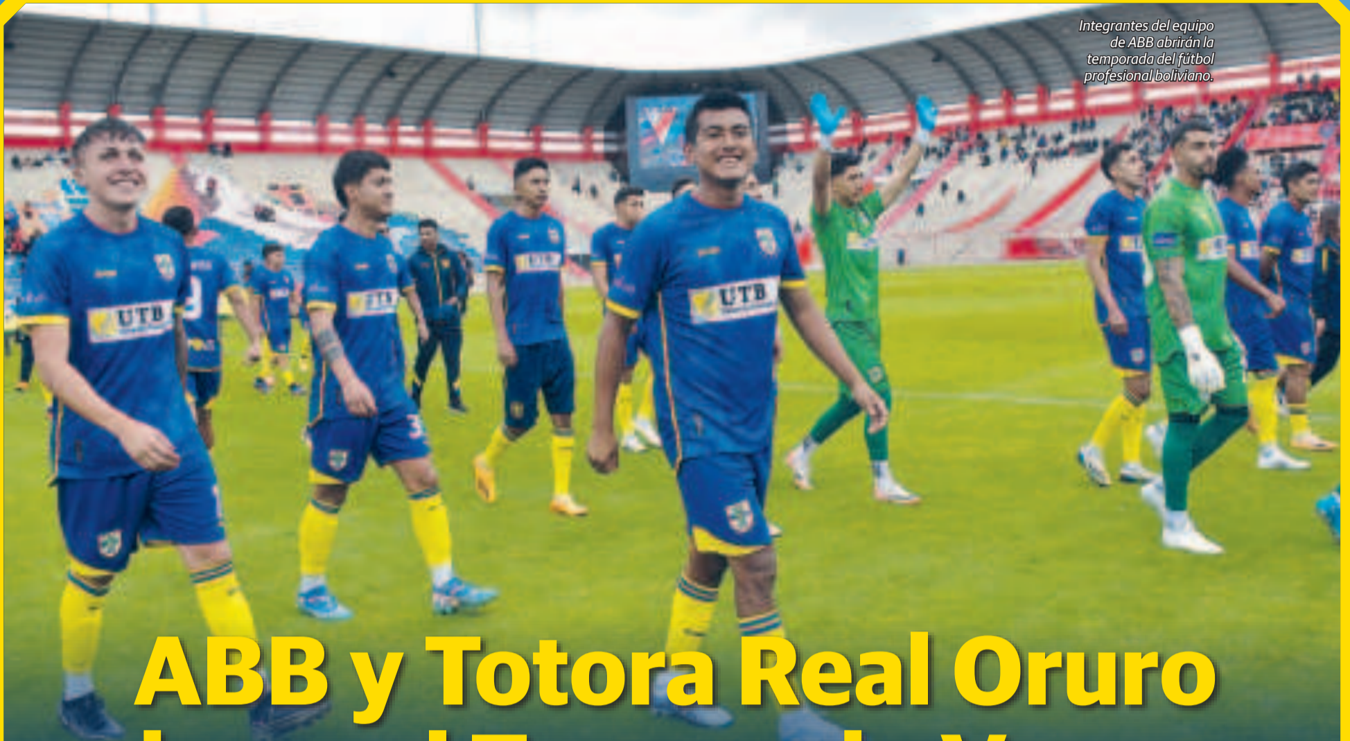
Integrantes del equipo de ABB abrirán la temporada del fútbol profesional boliviano.