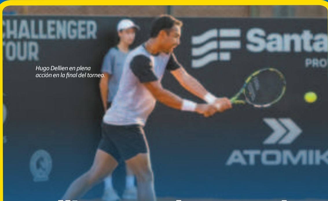
Hugo Dellien en plena acción en la final del torneo.