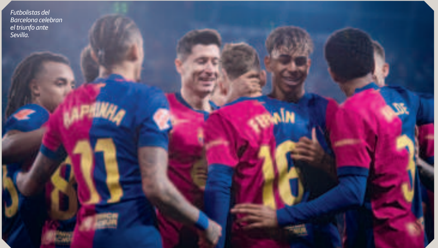
Futbolistas del Barcelona celebran el triunfo ante Sevilla.

para cabecear en el área chica antes de la salida del arquero y marcar el 2-1.