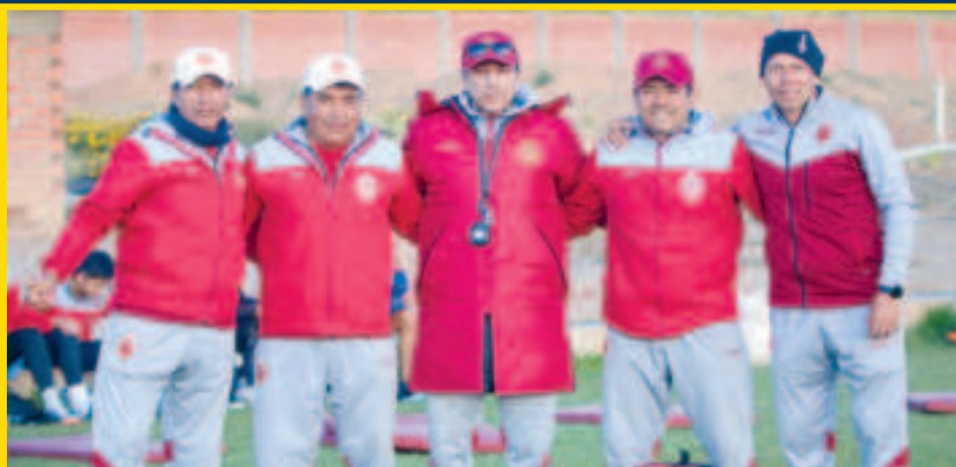
Miembros del cuerpo técnico del club Totorá Real Oruro.

Santa Cruz: Blooming vs. Real Santa Cruz/Royal Pari 20.00