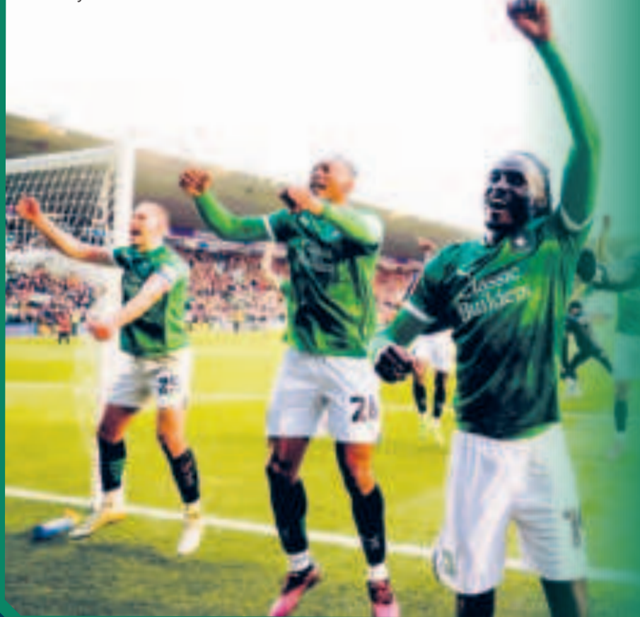
Jugadores del Plymouth Argyle festejan la gran victoria y hazaña.

En otros cotejos, Valencia venció 2-0 a Leganés y Getafe puso tierra de por medio al superar 1-0 a Deportivo Alavés y Real Sociedad batió a Espanyol 2-1.