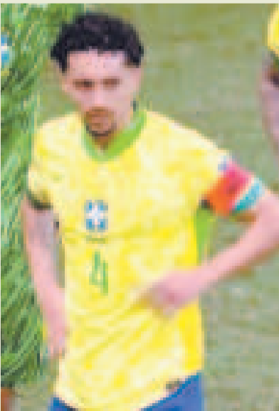
Marquinhos, capitán de Brasil.

Se viene la fecha 14 de las eliminatorias rumbo a la Copa Mundial 2026 y en ella se vivirá uno de los partidos más esperados durante la competencia, el enfrentamiento entre Brasil y Argentina, el cual siempre cuenta con buenos goles, grandes estrellas del mundo del fútbol y un ambiente incomparable dentro y fuera del estadio.