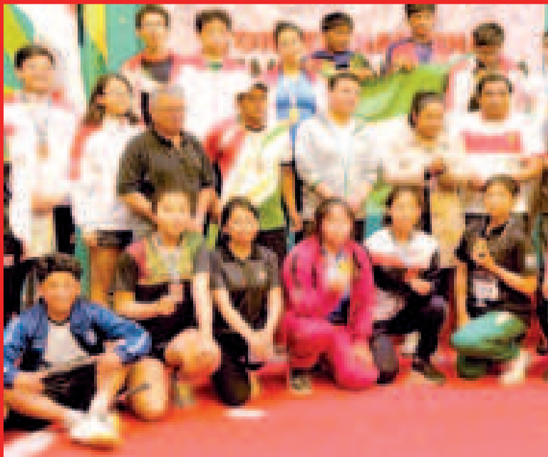
Deportistas que participaron y ganaron en el nacional de bádminton.