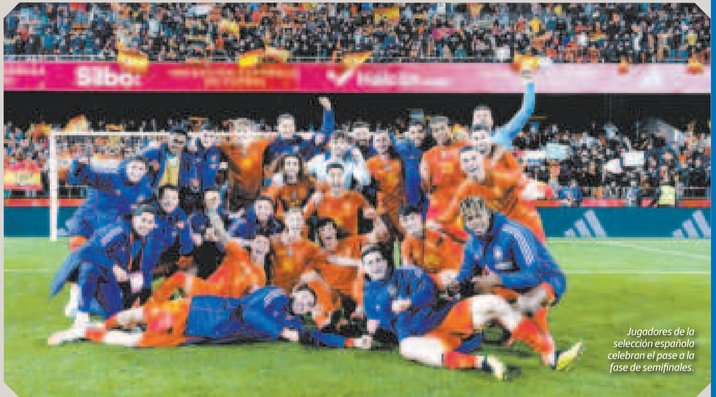
Jugadores de la selección española celebran el pase a la fase de semifinales.

España recibió a Países Bajos en el estadio de Mestalla, tras el empate 2-2 en la ida, y se repitió con dianas de Mikel Oyarzabal (8, de penal, y 67), y Memphis Depay Penalti (54) e Ian Maatsen (79).