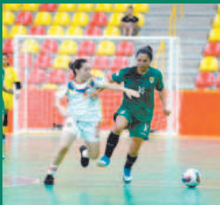
Una escena del partido entre las selecciones de futsal de Bolivia y Venezuela.