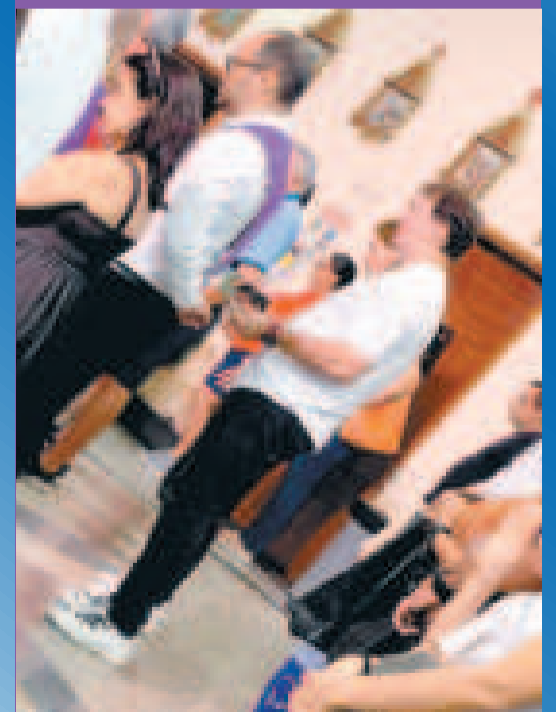
Néstor Lorenzo en la misa dominical.

La iglesia es cercana al sector en donde la Selección está concentrada, así que Lorenzo aprovechó para ir a la celebración católica.