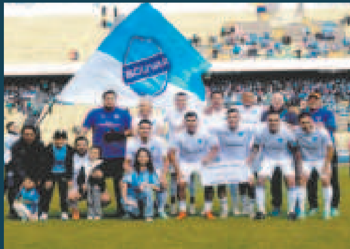
Integrantes de Bolívar que llegó a la semifinal de la Libertadores en 2014.