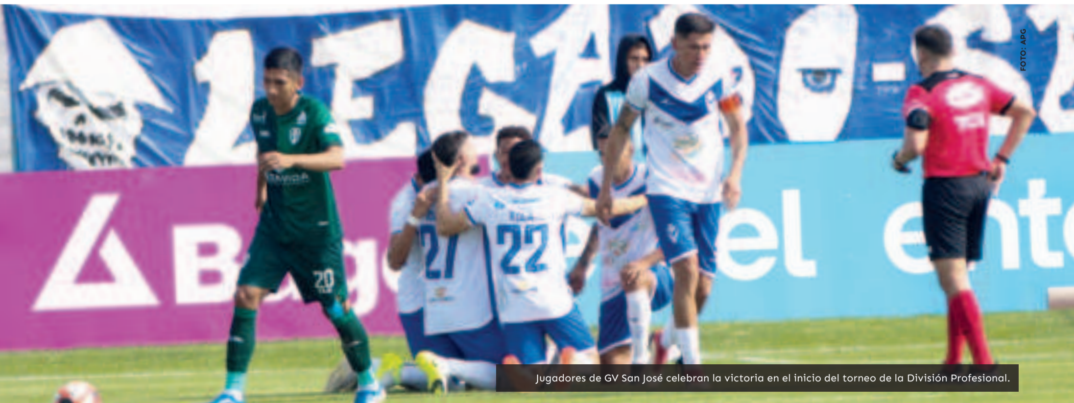
Jugadores de GV San José celebran la victoria en el inicio del torneo de la División Profesional.

El equipo orureño debutará en la Copa Sudamericana el 3 de abril frente a Unión Española de Chile.