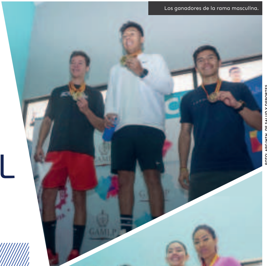
Los ganadores de la rama masculina.

La Federación Boliviana de Ráquetbol informó que en los próximos días dará a conocer la nómina de la selección nacional para jugar el Panamericano de Guatemala, que se jugará del 11 al 19 de abril.