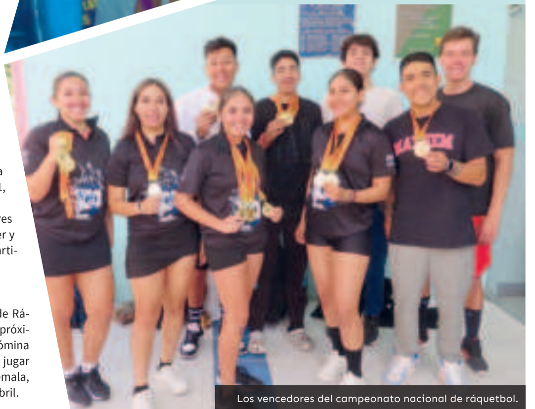
Los vencedores del campeonato nacional de ráquetbol.