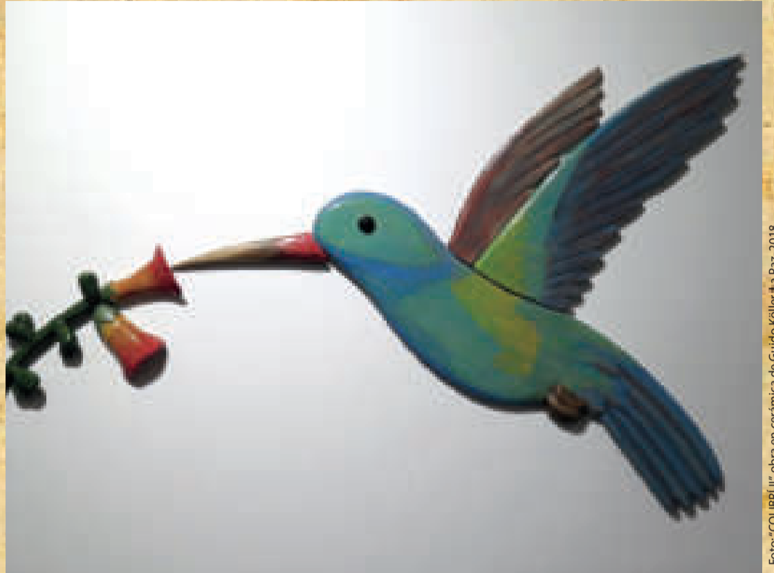
Foto: "COLIBRÍ II", obra en cerámica de Guido Köller, La Paz, 2018