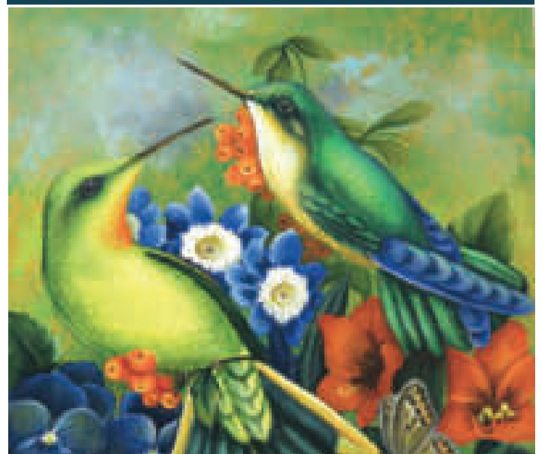
"COLIBRIS", pintura en base a acrílico de la artista nacional Olga González Alcón, del año 2002.