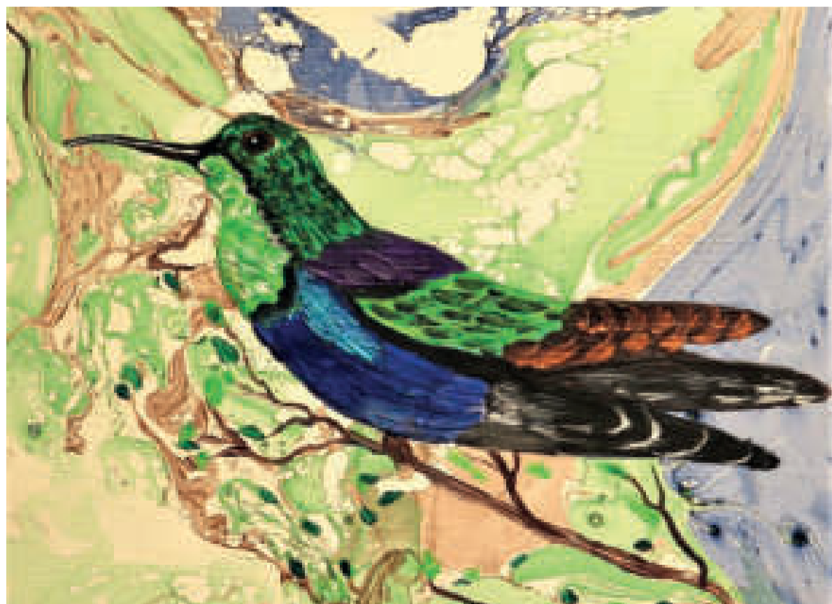
"BELLEZA SILVESTRE". Pintura de Gilka Wara Libermann, obra expuesta el año 2020 en La Paz.