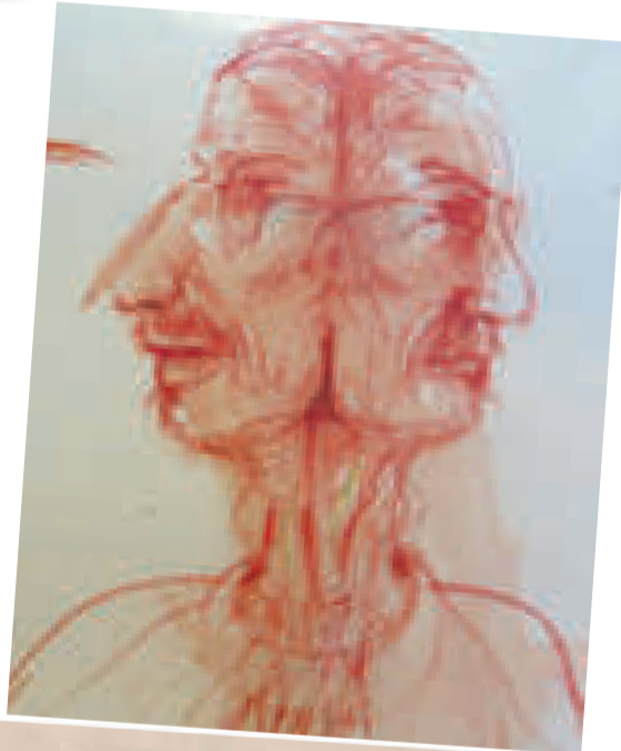
"AUTORRETRATO", dibujo de Edgar Arandia, obra realizada el año 2012.