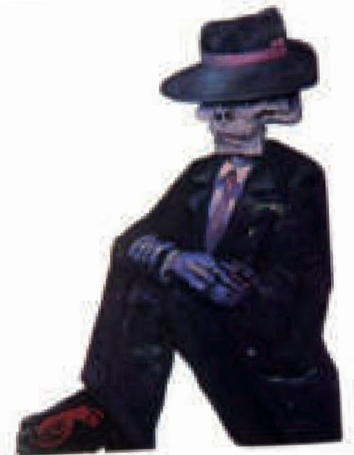
"CALAVERA DE BORDA", arte realizado con técnica mixta. Fechado en el año 1996.