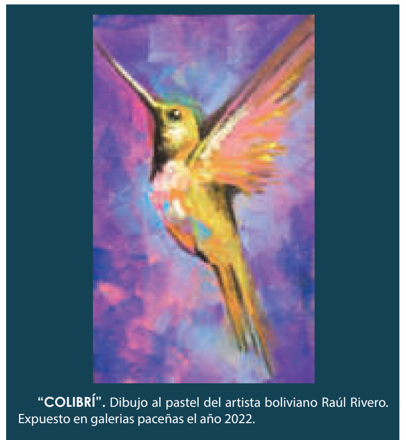
"COLIBRÍ". Dibujo al pastel del artista boliviano Raúl Rivero. Expuesto en galerías paceñas el año 2022.