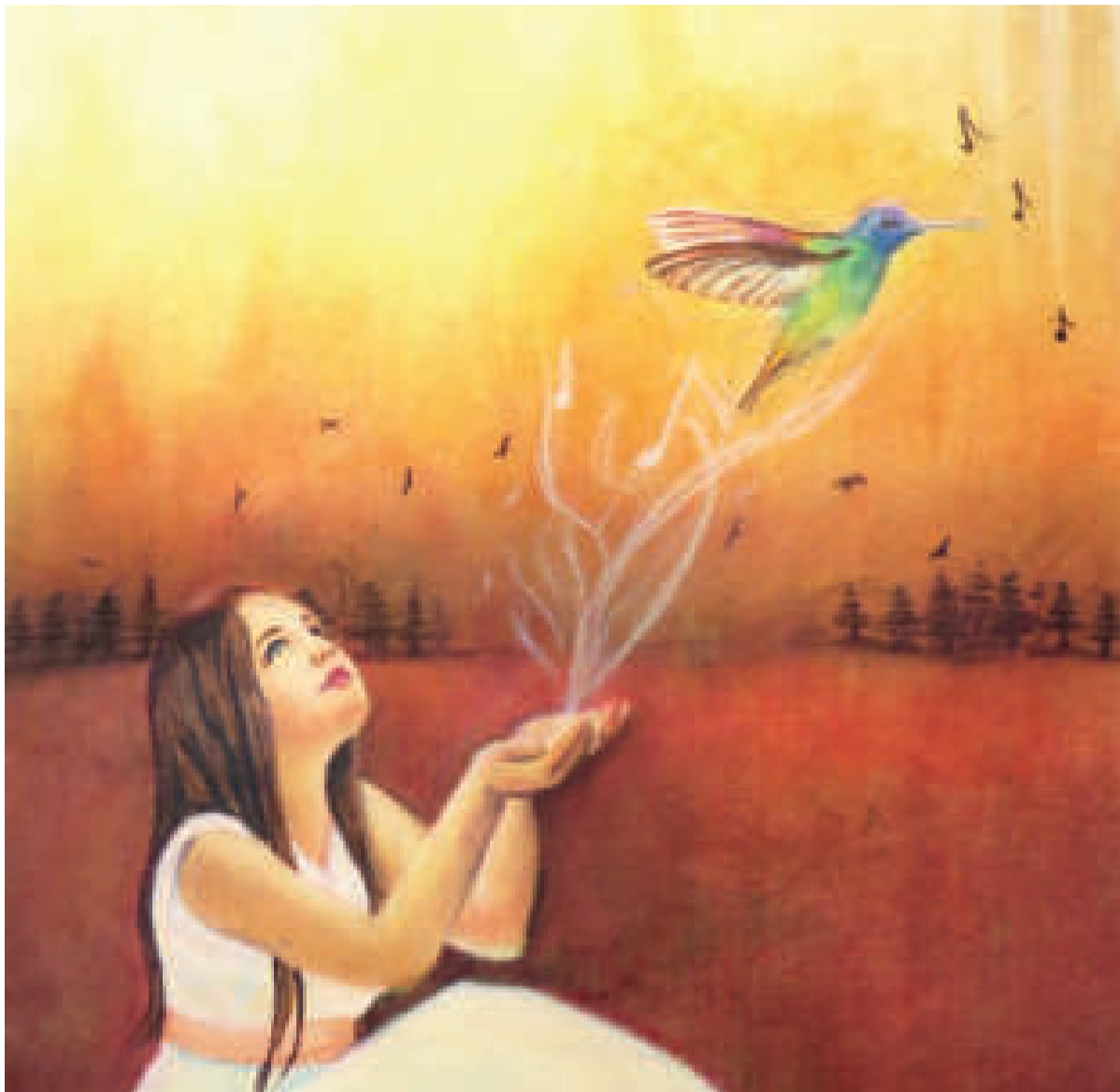
Foto: "COLIBRI", pintura de Jhessica Miranda Limachi, La Paz, 2021