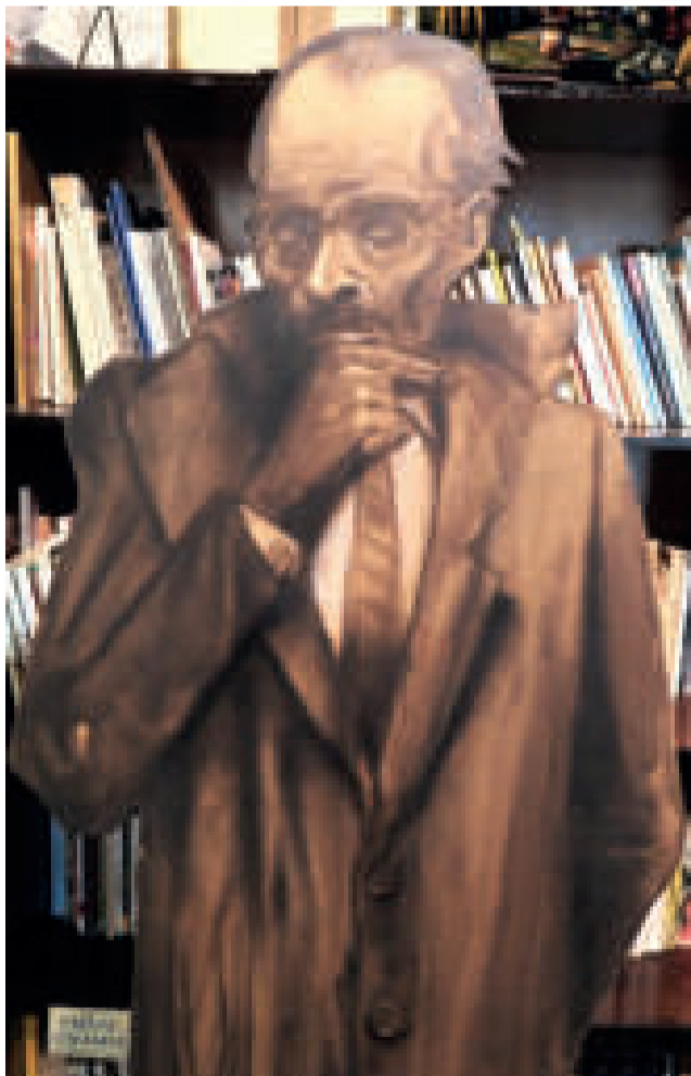
"JAIME SAENZ", retrato del escritor paceño. Dibujo sobre venesta de Edgar Arandia. Obra fechada en el año 2021.