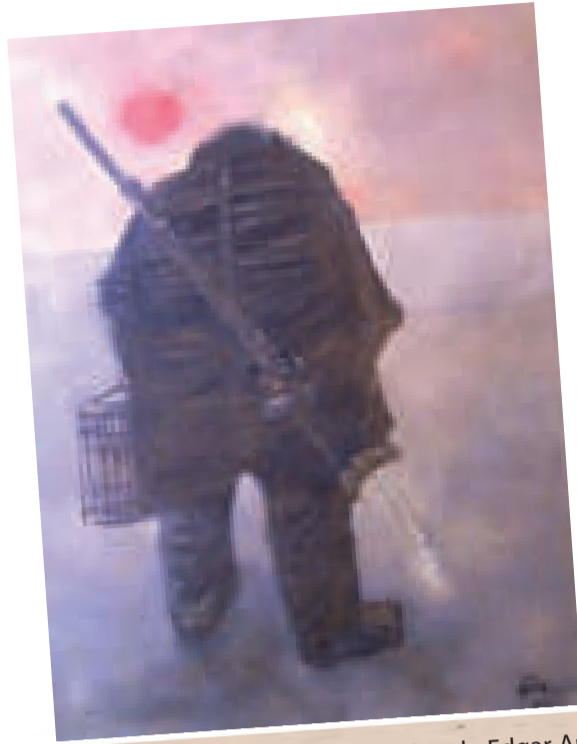
"FÁBULA DEL CONSPIRADOR", óleo de Edgar Arandia con el que ganó en Segundo Premio en Pintura del Salón 'Pedro Domingo Murillo' en 1974.