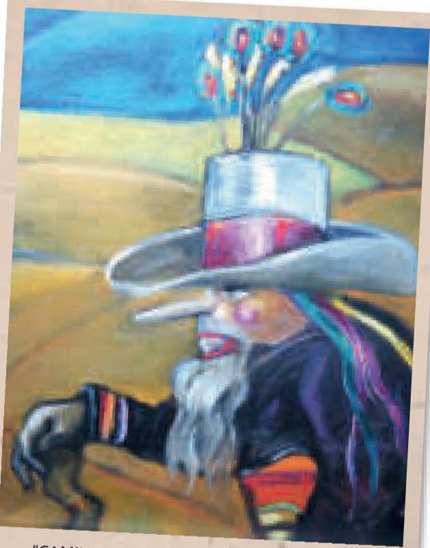
"CAMINO A TORO TORO", acrílico sobre tela de Edgar Arandia. Obra del año 2014.