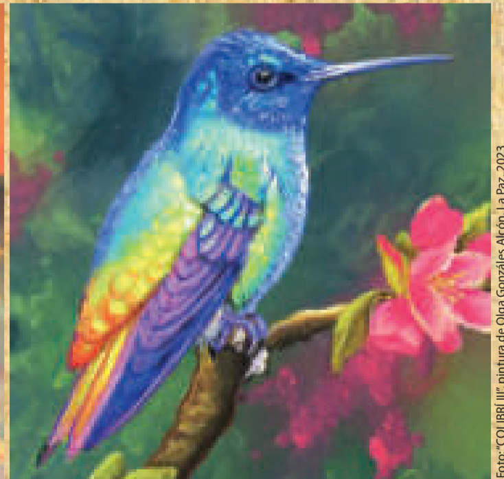
Foto: "COLIBRÍ III", pintura de Olga Gonzáles Alcón, La Paz, 2023

● EL COLIBRÍ EN EL ARTE Y LA POESÍA BOLIVIANA