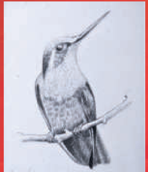
"COLIBRÍ". La delicada figura de un colibrí en un momento de descanso. Dibujo del artista paceño Juan Mayta Ascencio, del año 2019.