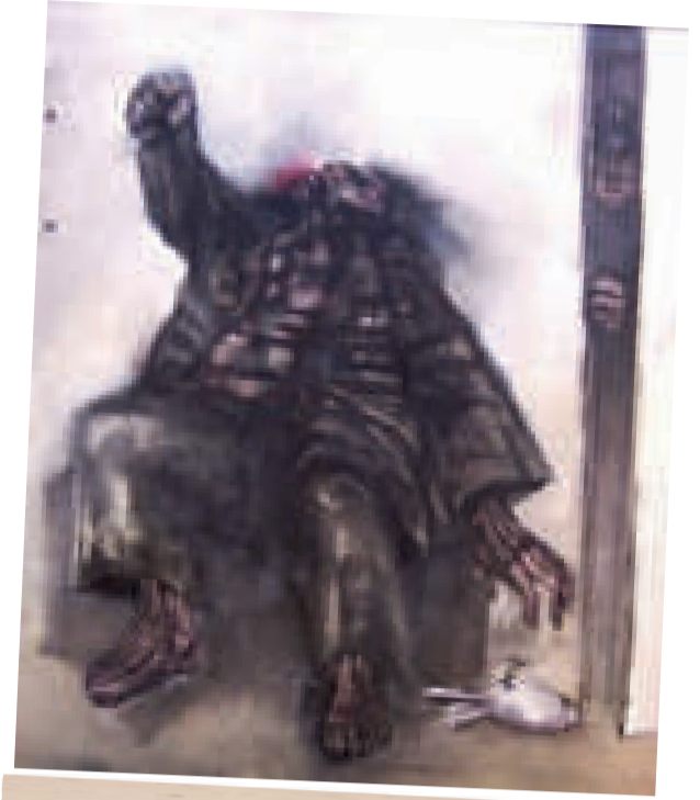
"C...", obra de Edgar Arandia con la que ganó el Primer Premio en Pintura del Salón Murillo el año 1975.