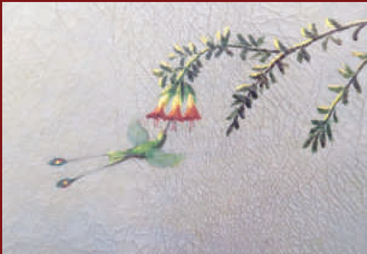
COLIBRÍ DE ARTURO BORDA, imagen que data de 1948 y que es un detalle del cuadro "La lucha del arte con los ismos" del pintor paceño Arturo Borda. El cuadro pertenece a los Museos Municipales de La Paz.