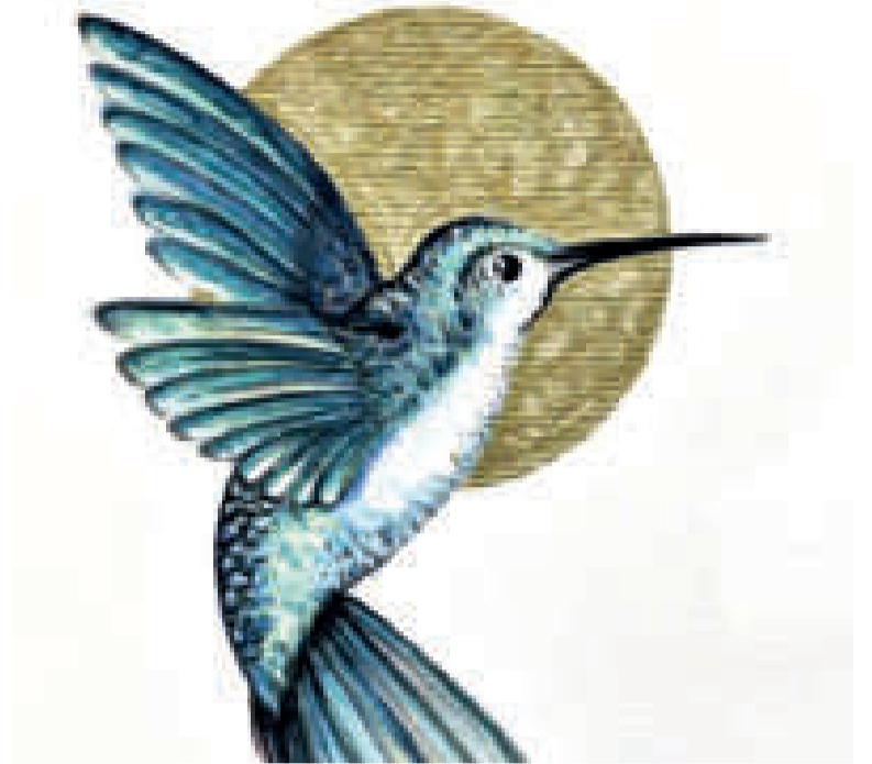
"COLIBRÍ". La noble ave en pleno vuelo, así captada por la artista nacional Leticia Maidana Pino. Obra del año 2018.