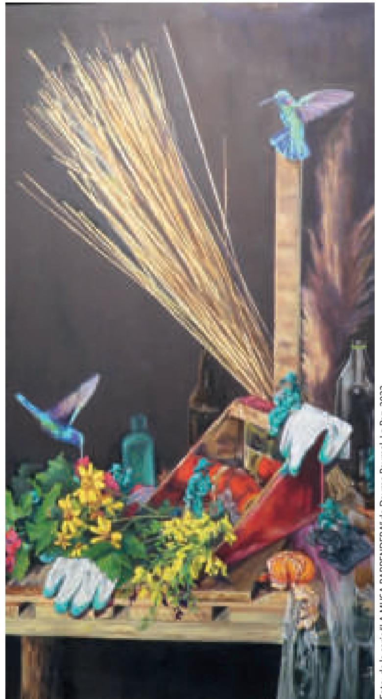
Foto: de la serie "LA MUSA BARRENDERA" de Dayme Paymal, La Paz, 2022