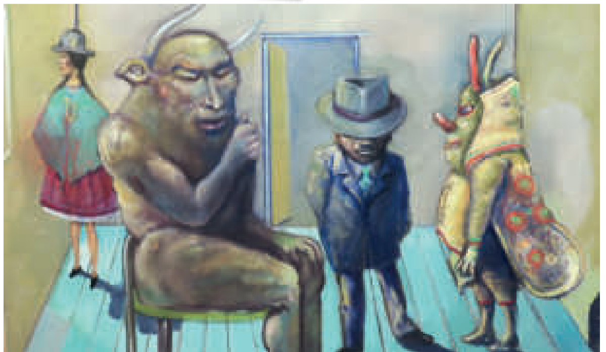
"CHUQUILKAMIR BERNITA", óleo sobre tela de Edgar Arandia. Obra expuesta en galerías paceñas el año 2022.