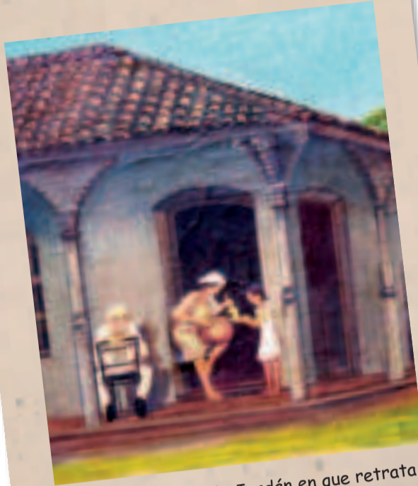
Detalle de óleo de Jordán en que retrata a la vendedora de tujuré en una tinaja.