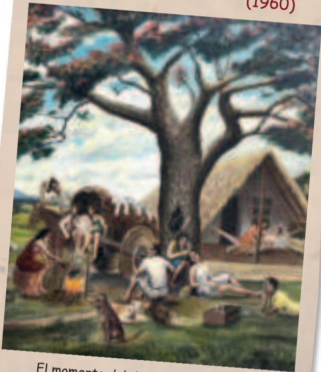
El momento del descanso retratado por Jordán. Detalle de óleo.