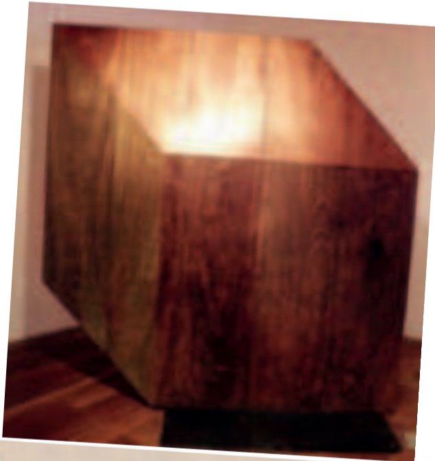
"CUBO II", talla en madera de Callaú. Obra fechada en el año 2008.