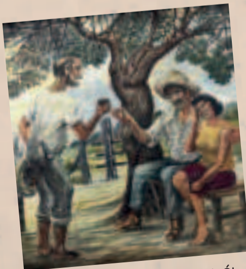
Escena de una hacienda oriental. Óleo de Armando Jordán.