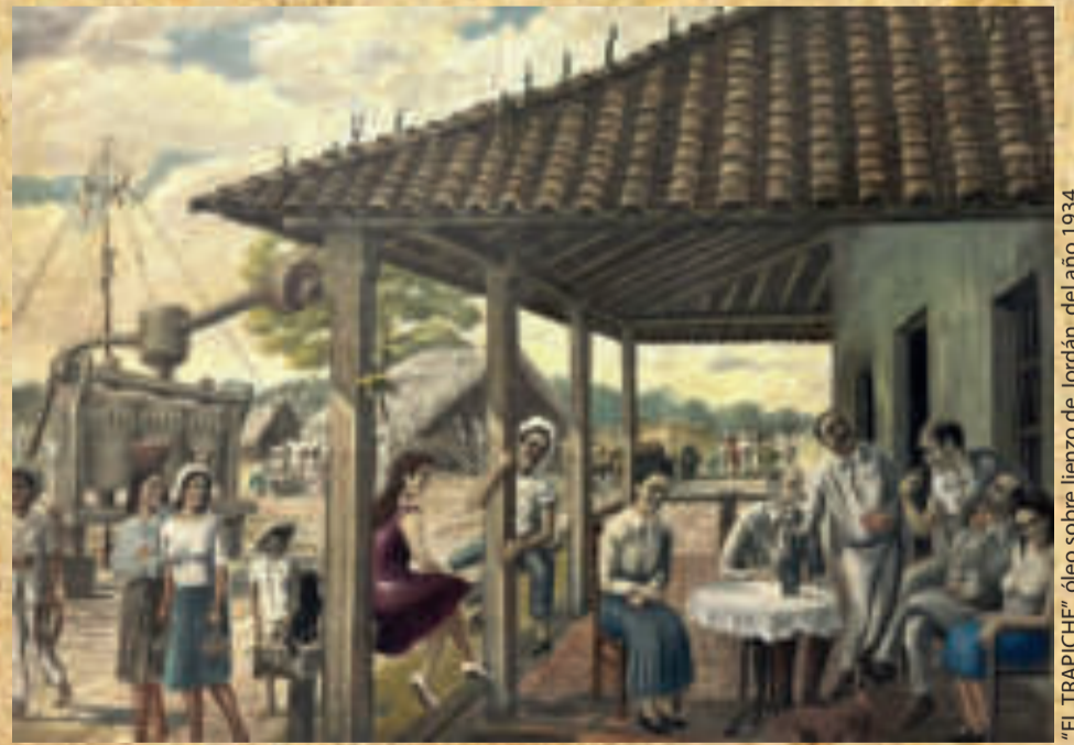
"EL TRAPICHE", óleo sobre lienzo de Jordán, del año 1934.