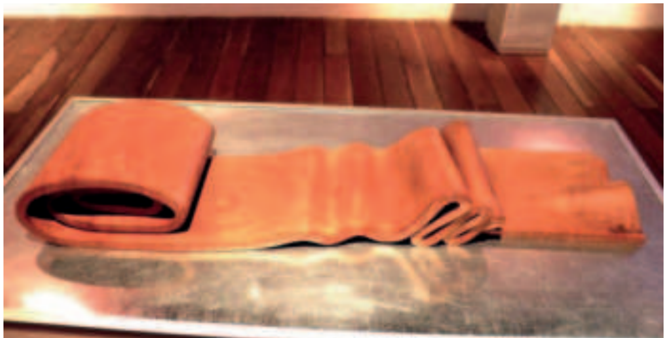
"PLIEGUE", talla en madera de Marcelo Callaú, del año 1986. Obra expuesta en La Paz en el marco de 'Bolivia. Los caminos de la escultura' el 2010.