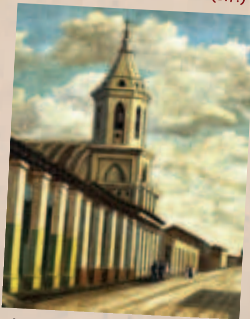
Detalle de pintura en que aparece la Iglesia de La Merced, en Santa Cruz.