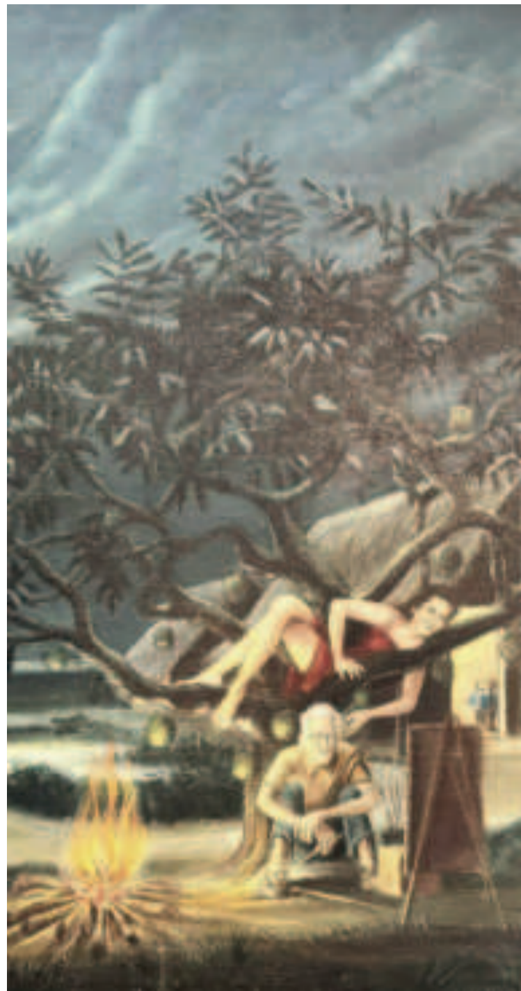
"NO MÁS TUTUMO", detalle de óleo del año 1960. Autorretrato del artista.