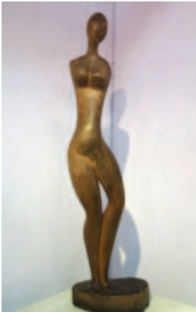
"DESNUDA", talla en madera de Callaú. Obra fechada en el año 1967 y expuesta en la ciudad de La Paz el año 2017.