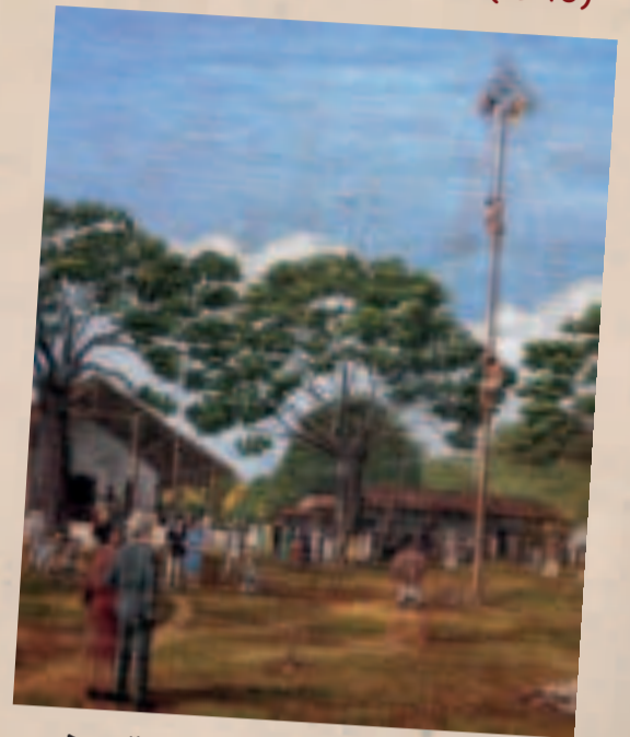
Detalle de pintura de Jordán, también conocida como 'El palo encebao'.