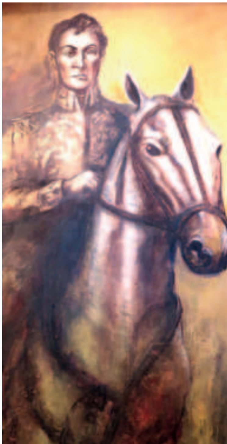
“SIMÓN BOLÍVAR”, pintura realizada por Gastón Ugalde en los muros del Palacio de Gobierno, La Paz

“La gloria está en ser grande y en ser útil” (Simón Bolívar)