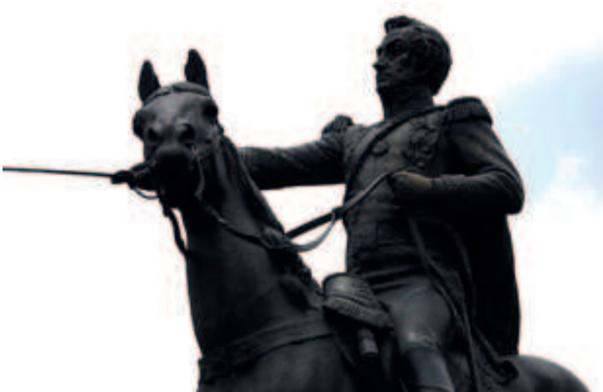
Foto: detalle de Monumento a Simón Bolívar, Plaza Venezuela, La Paz

La ciudad de las retamas con los ojos transparentes, mira el camino de piedra que trepa el cerro y se pierde. ¡El Illimani la cuida con el silencio de siempre! Los balcones asemejan encajes que el roble teje: sus paredes de cal viva blanquean el aire, alegres. Los patios se han olvidado de los geranios que crecen y escuchan la dulce música que rumorea en las fuentes. Los zaguanes se conmueven. ¡Hay un latido solemne! Las campanas de la plaza anuncian que son las nueve.