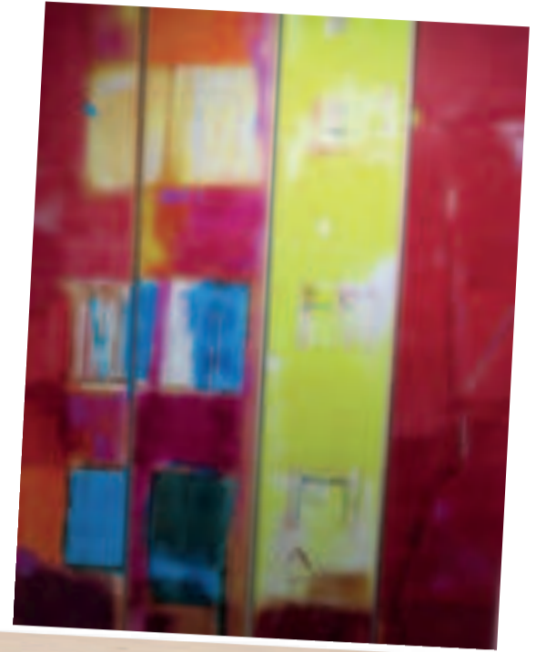
"HOTEL DE PASO", acrílico sobre lienzo de Fabbri. Expuesta en Galería 'Altamira', en La Paz, el año 2021.