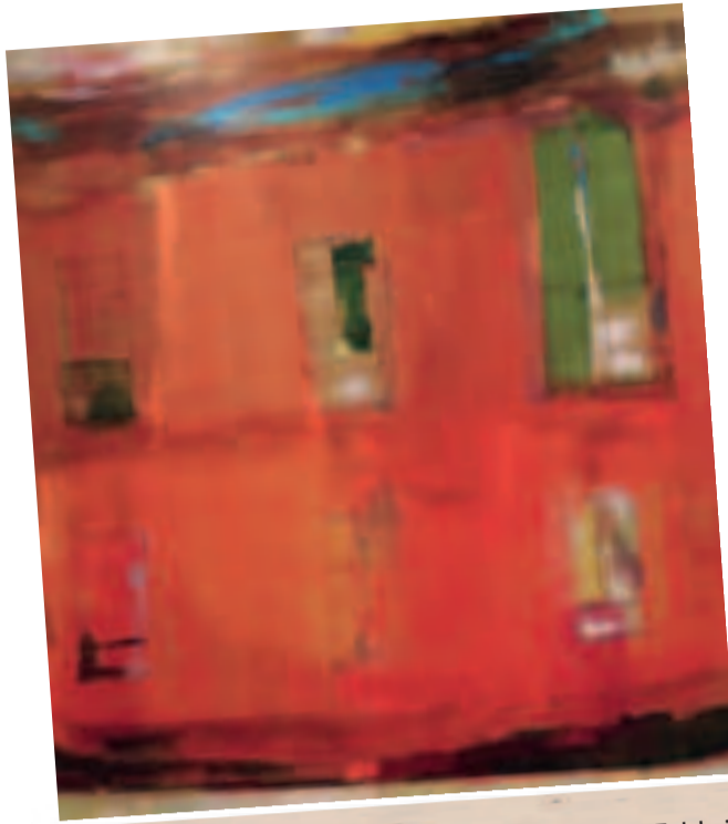
"MUNDO INTERIOR", acrílico sobre lienzo de Fabbri, expuesta en la galería 'Mérida Romero' el año 2016.