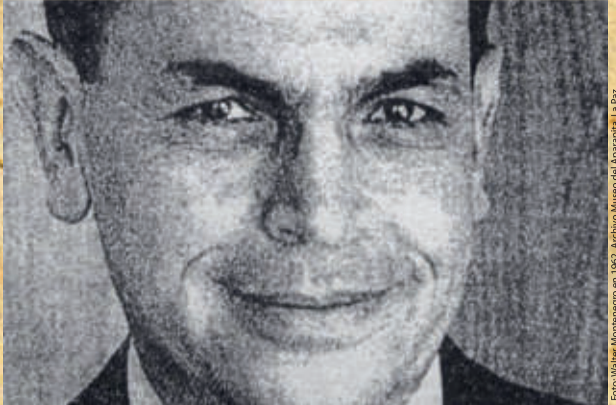
Foto: Walter Montenegro en 1962.