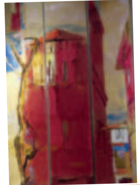
"CASA EN ALTURA", acrílico sobre lienzo de María de los Angeles Fabbri, del año 2023.