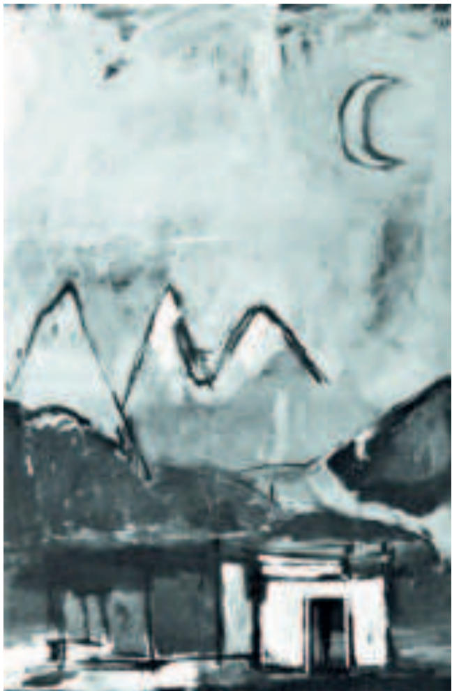
"ILLIMANI", óleo sobre tela de Fabbri fechado el año 1991. Foto de Pedro Querejazu, tomada de catálogo de la artista.

Elías Blanco Mamani, La Paz, 2005 (Foto: Elías Blanco, La Paz, 2012)