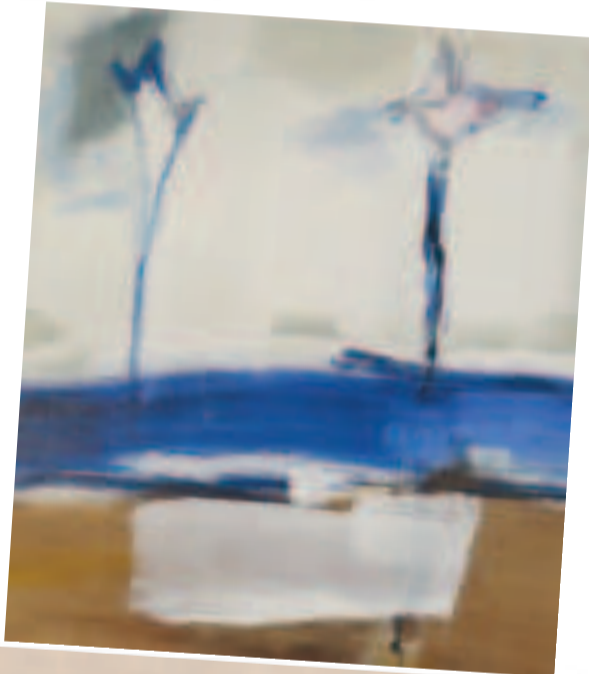
"TULIPANES", acrílico sobre lienzo de Fabbri, expuesta el Galería 'Altamira' el año 2021.