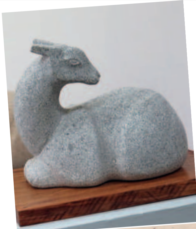
“ESCULTURA EN PIEDRA ‘SIN TÍTULO’ de Pastor Villanueva, expuesta en La Paz el año 2019.