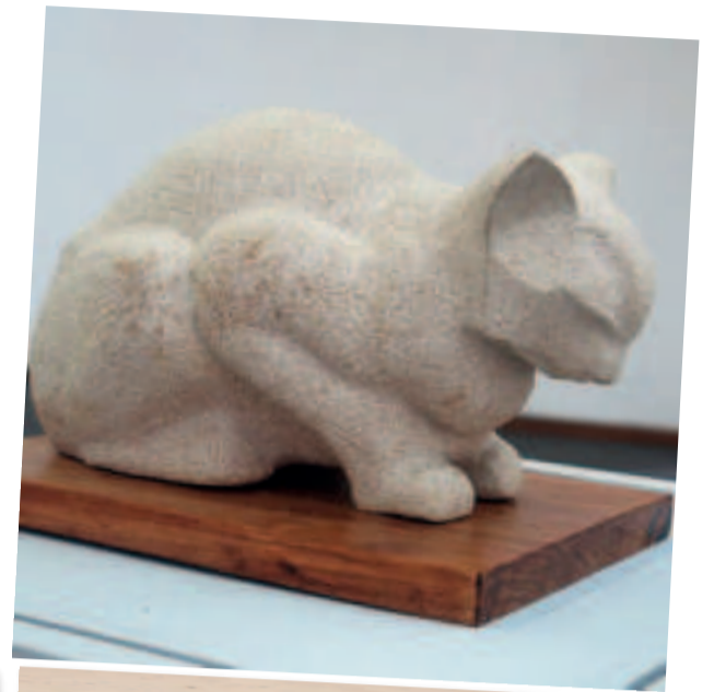
“GATO”, escultura en piedra arenisca de Villanueva, expuesta en La Paz el año 2019.