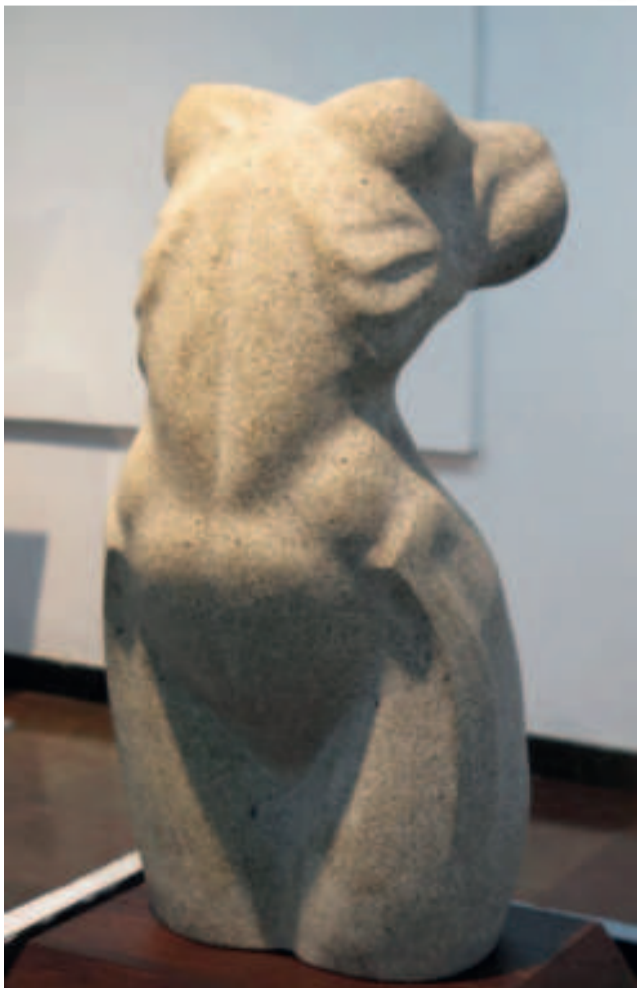
“TORSO”, tallado en piedra granito de Pastor Villanueva. Obra expuesta en galerías paceñas el año 2023.