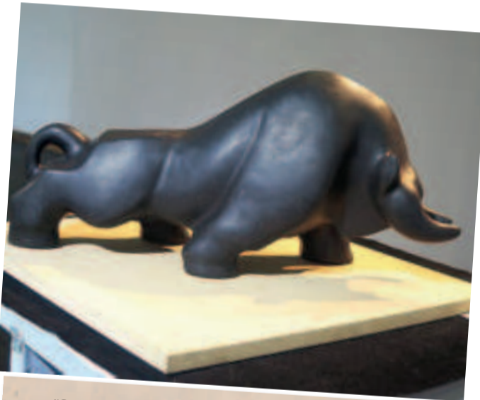
“SOBERANO”, escultura en piedra basalto de Pastor Villanueva, del año 2024.