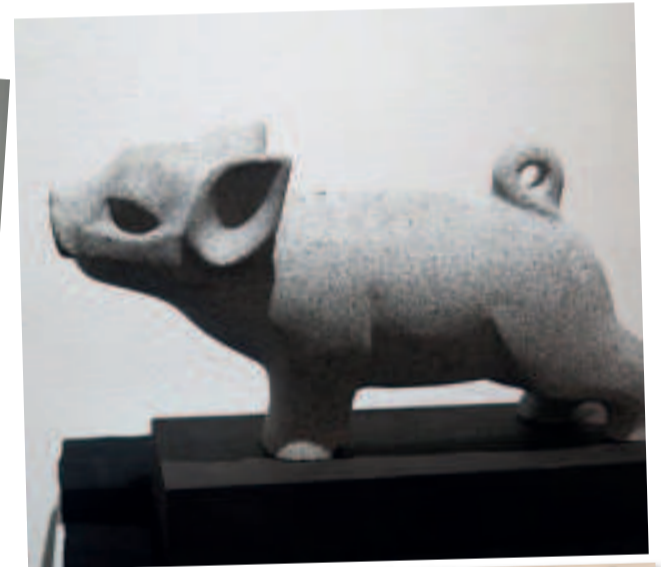
“VALENTÍA”, escultura en piedra granito de Villanueva. Expuesta en La Paz el año 2024.