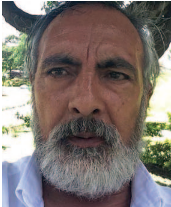
Oruro, 2018