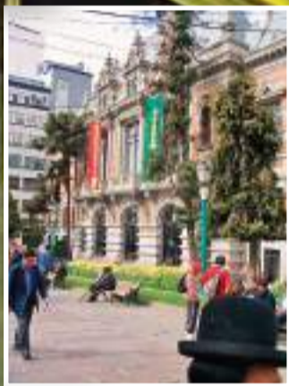
Palacio consistorial de La Paz