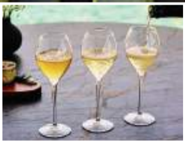
Tipos de cava