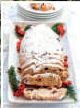
Stollen de Alemania