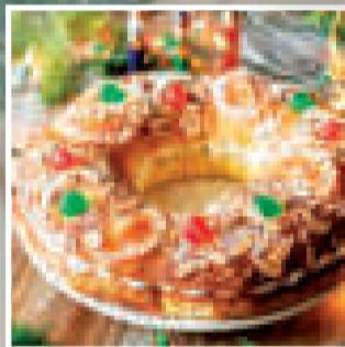
Roscón de reyes español