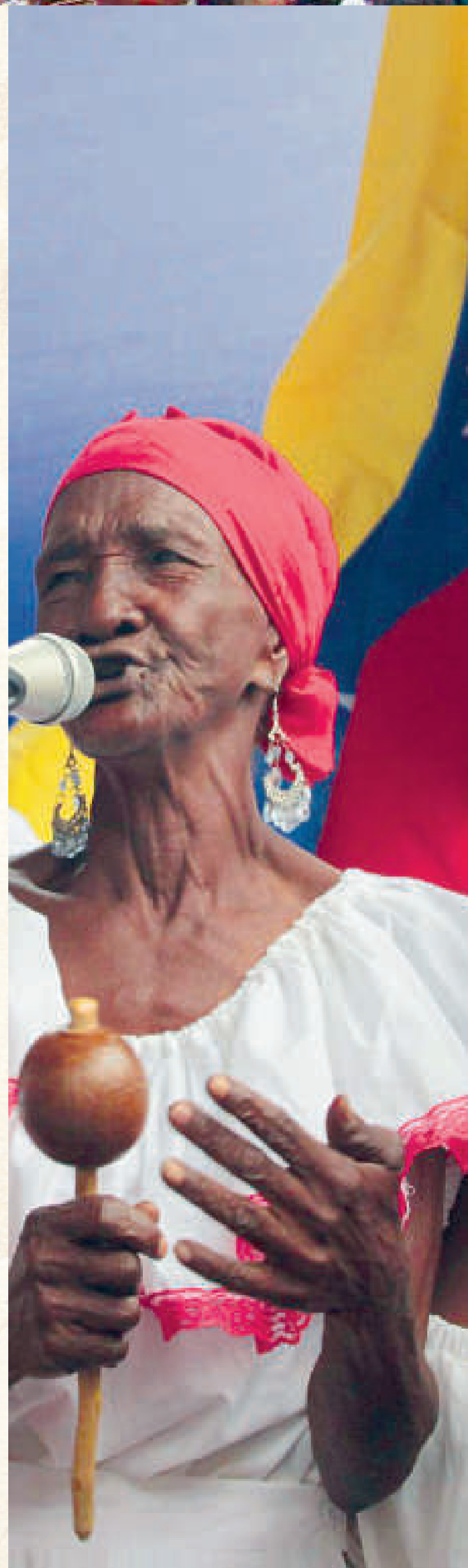
Juana Ramírez La Avanzadora