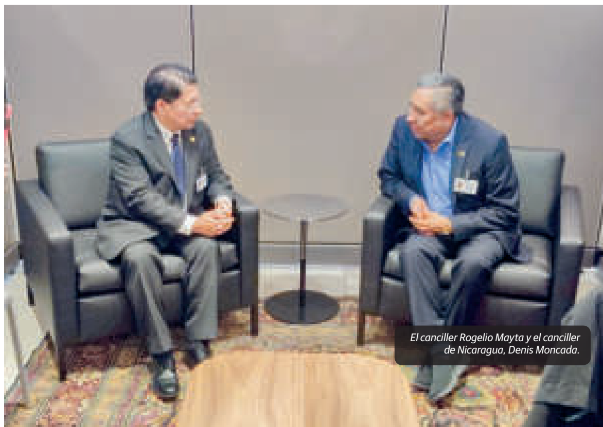
El canciller Rogelio Mayta y el canciller de Nicaragua, Denis Moncada.