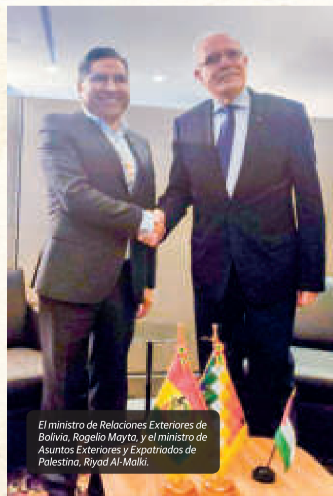
El ministro de Relaciones Exteriores de Bolivia, Rogelio Mayta, y el ministro de Asuntos Exteriores y Expatriados de Palestina, Riyad Al-Malki.