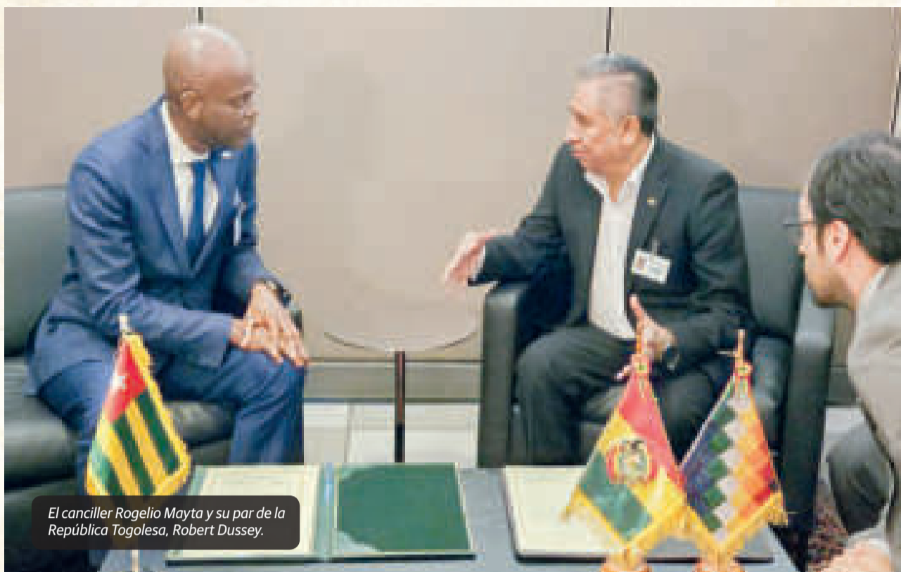
El canciller Rogelio Mayta y su par de República Togolesa, Robert Dussey.

Durante su participación en el Debate Gene-