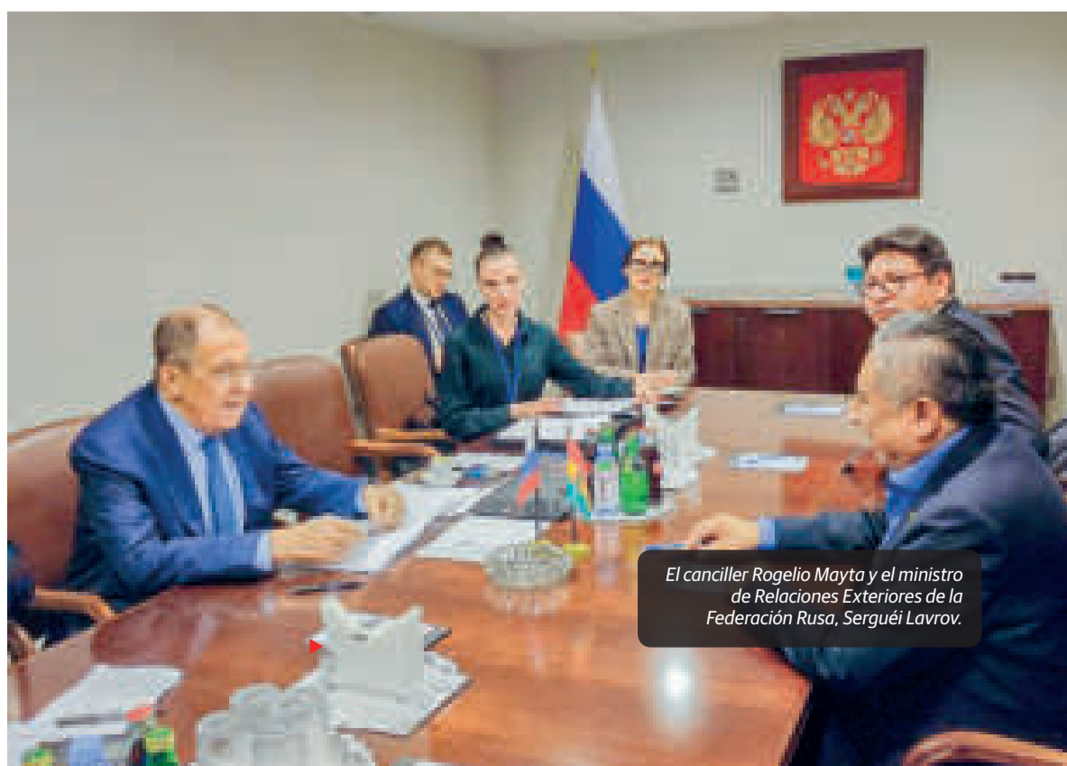
El canciller Rogelio Mayta y el ministro de Relaciones Exteriores de la Federación Rusa, Serguéi Lavrov.