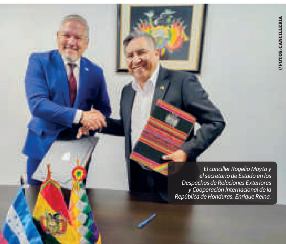
El canciller Rogelio Mayta y el secretario de Estado en los Despachos de Relaciones Exteriores y Cooperación Internacional de la República de Honduras, Enrique Reina.

Si bien la delegación boliviana sostuvo cerca de 10 reuniones bilaterales, es necesario destacar tres que se realizaron con los representantes de la República de Honduras (América Central), ►