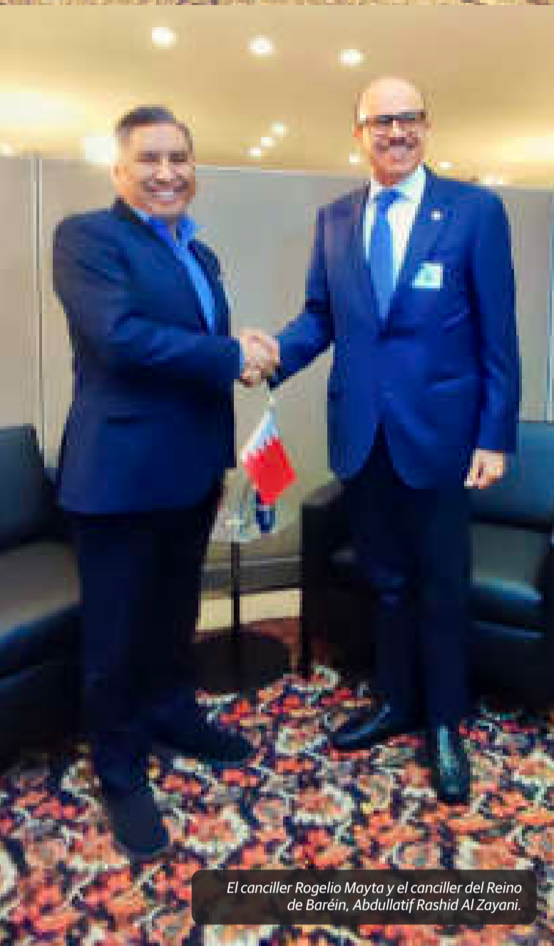
El canciller Rogelio Mayta y el canciller del Reino de Baréin, Abdullatif Rashid Al Zayani.

La reunión que pudieron sostener los ministros en Nueva York sirvió para dar los primeros pasos en este objetivo, con la organización e identificación del proceso que deberán seguir en este cami-