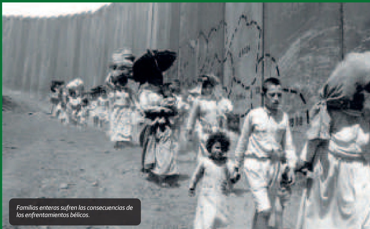
Familias enteras sufren las consecuencias de los enfrentamientos bélicos.

Argelia con 1,5 millones de mártires, niños, mujeres y familias enteras masacrados, torturados por las bestias fascistas criminales francesas con su ejército genocida de ocupación, donde la resistencia argelina del Frente de Liberación Nacional derrota al 4to ejército más moderno de esa época, a través de la guerra de guerrillas contra el imperialismo colonialista europeo y