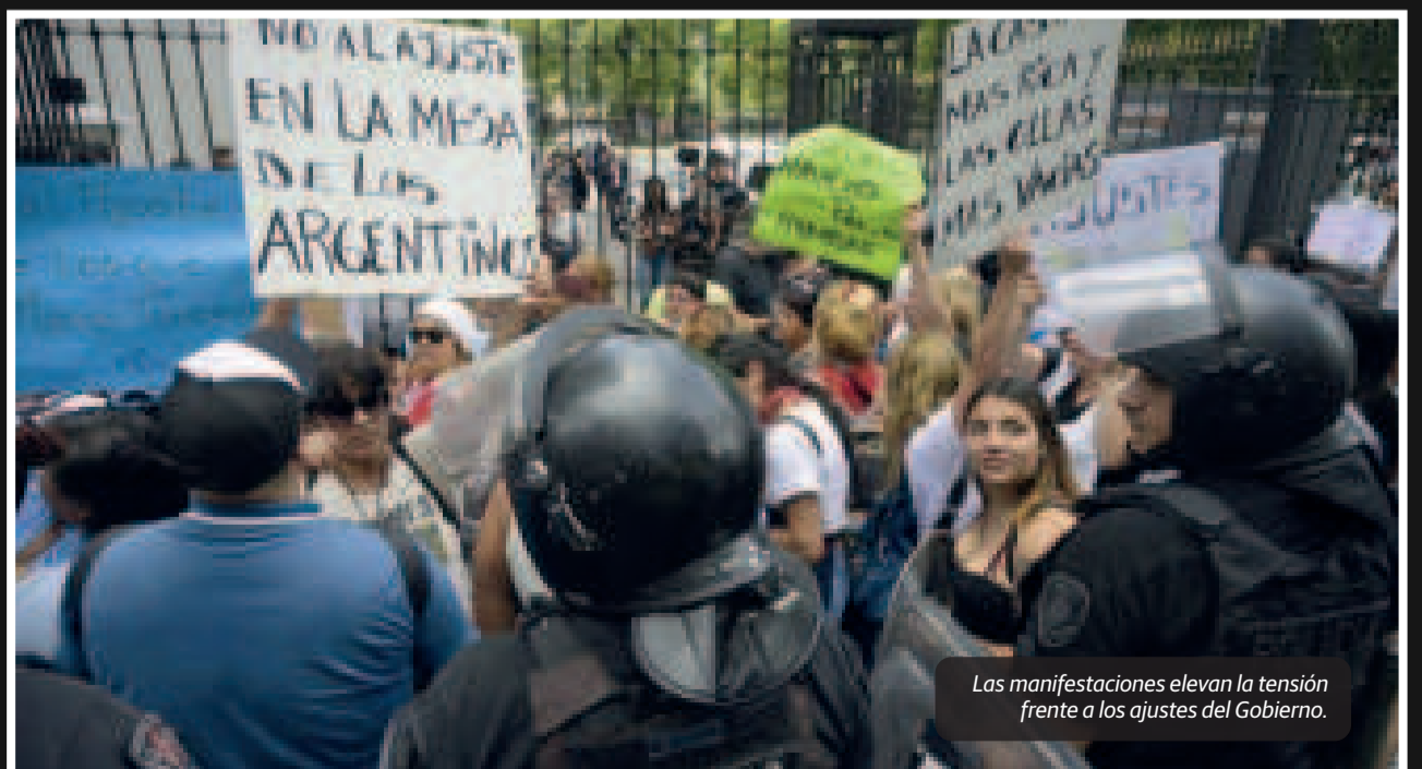
Las manifestaciones elevan la tensión frente a los ajustes del Gobierno.

Para el diputado de Unión por la Patria Carlos Heller, sin una reactivación de la economía, el ajuste sólo tenderá a ser más fuerte y, en este contexto, “el límite del ajuste sólo es la capacidad de resistencia de los ajustados”.