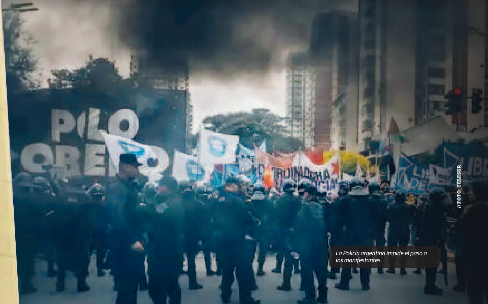
La Policía argentina impide el paso a los manifestantes.

Si bien desde el Gobierno intentaron minimizar lo ocurrido, desde las centrales sindicales destacaron como “contundente” la medida ▶