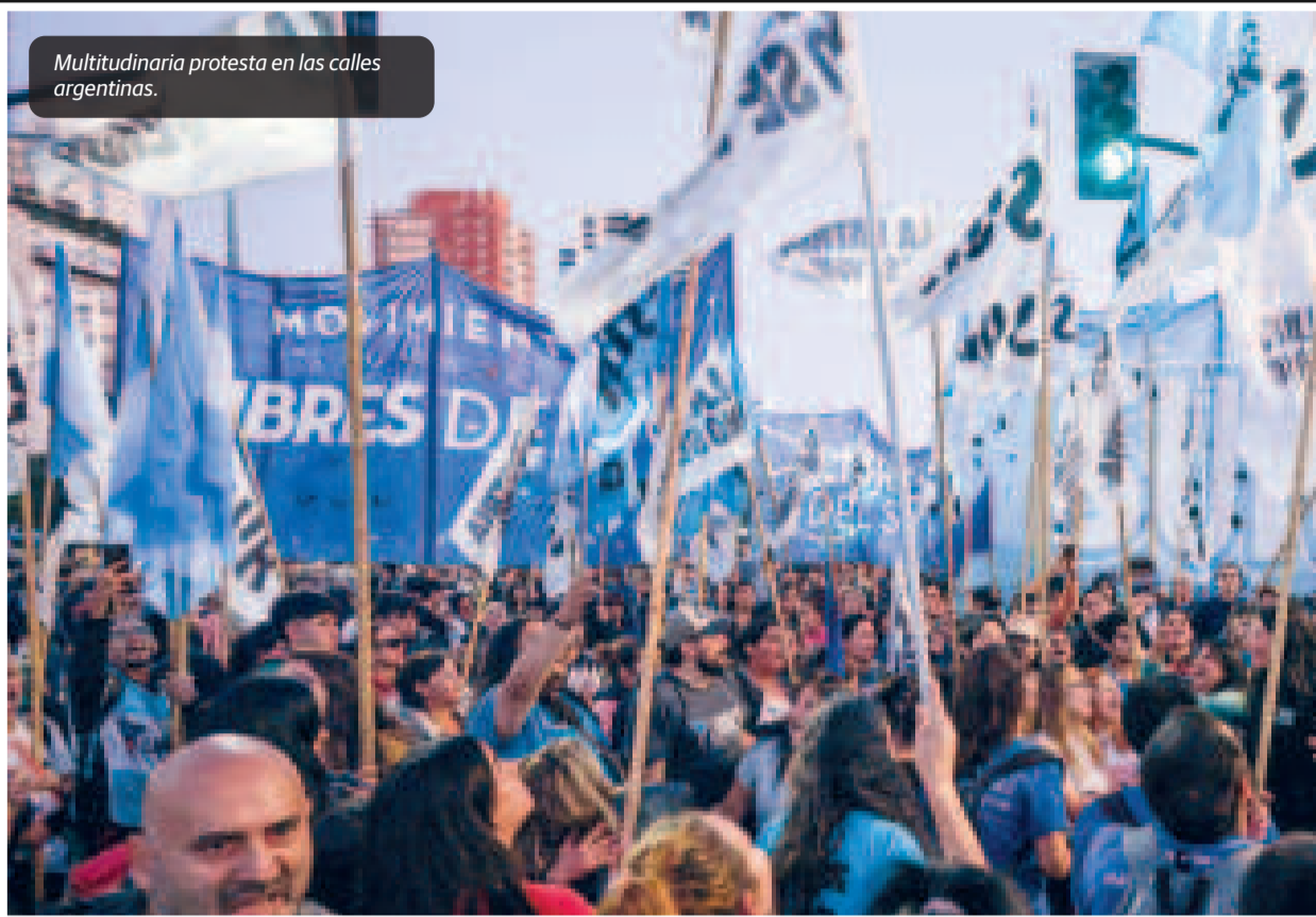
Multitudinaria protesta en las calles argentinas.